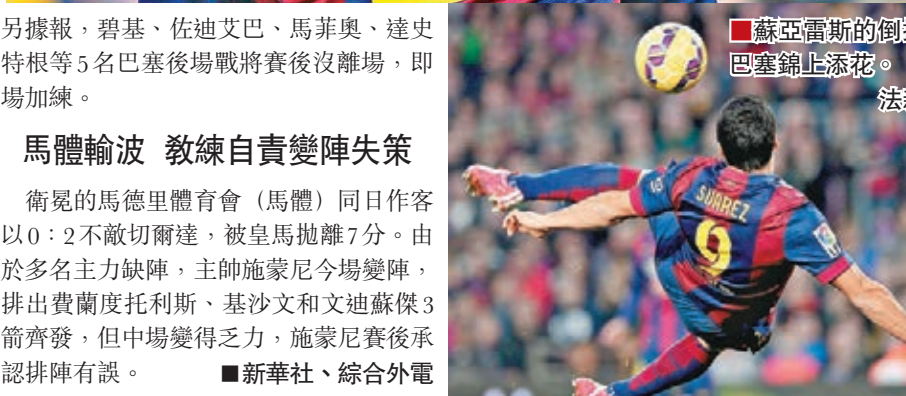
蘇亞雷斯的倒掛為巴塞錦上添花。