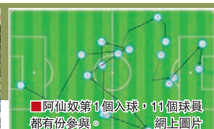
阿仙奴第1個入球,11個球員都有份參與。

昨凌晨英格蘭足總盃16強,法國前鋒基奧特於27分鐘在各隊友都有份觸球的攻勢中接應基爾基比斯傳送射入,2分鐘後再應阿歷斯山齊士的角球小禁區邊窩利射入,協助衛冕的阿仙奴(槍手)主場贏英冠(即第2級別)米杜士堡2:0出線。