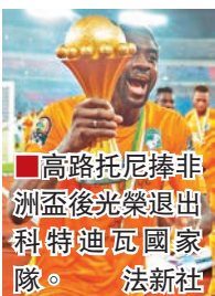
高路托尼捧非洲盃後榮退出科特迪瓦國家隊。

隨科特迪瓦捧起今屆非洲國家盃的33歲中堅高路托尼昨宣布退出國家隊。踢過阿仙奴和曼城、現效力利物浦的他隨「非洲大象」征戰了2006、2010及2014世界盃,上陣過百次。