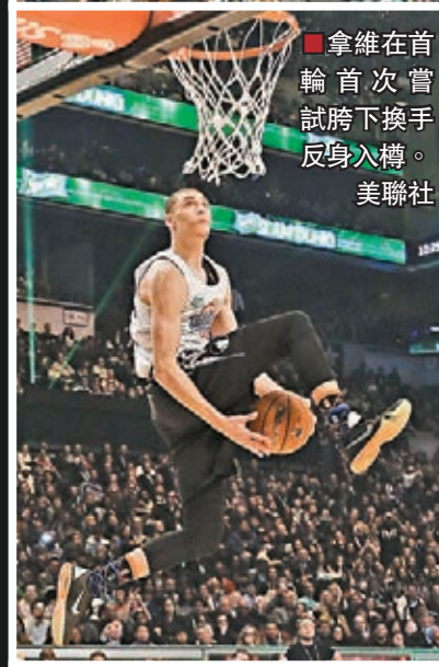
拿維在首輪首次嘗試胯下換手反身入樽。