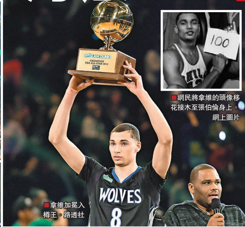
拿維加冕入樽王。