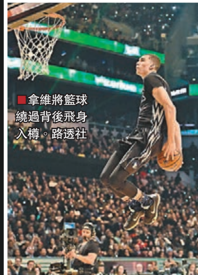
拿維將籃球繞過背後飛身入樽。