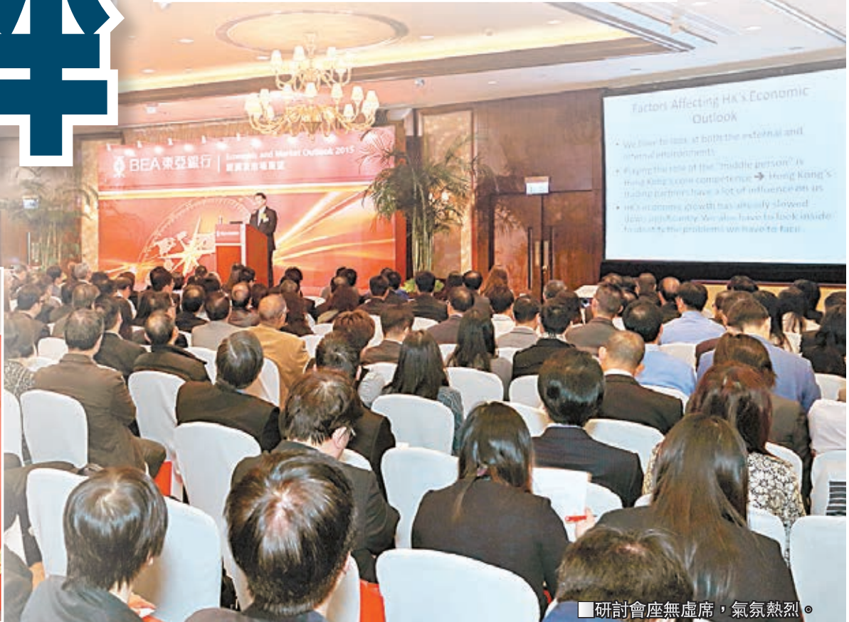
研討會座無虛席，氣氛熱烈。