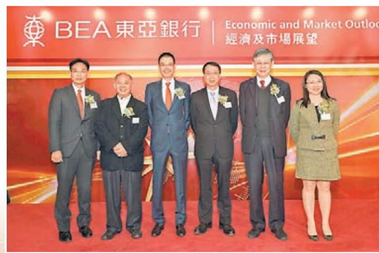
東亞銀行每年舉辦大型研討會，邀請財經界名人與企業客戶分享經濟展望。該行執行董事兼行政總裁李民橋先生（左三）與眾講者合照。

隨著人民幣逐步國際化的發展契機，該行更特設中港融資部，配合境內外企業客戶的營運和融資需要，專門研發創新跨境人民幣產品，包括信用證、押匯融資、內保外貸、貿易結算融資方案，乃至跨境資金管理、匯款、保險等。東亞中國於2013年初成功推出供應鏈融資試點計劃後，於2014年上半年將計劃擴展至所有內地分行，為核心客戶及其上下游合作夥伴提供全面的金融服務。2014年1月，東亞銀行更邁進一步，在上海自由貿易試驗區開設網點，成為首批進駐自貿區的外資銀行之一，幫助企業客戶把握自貿區所帶來的業務機遇。