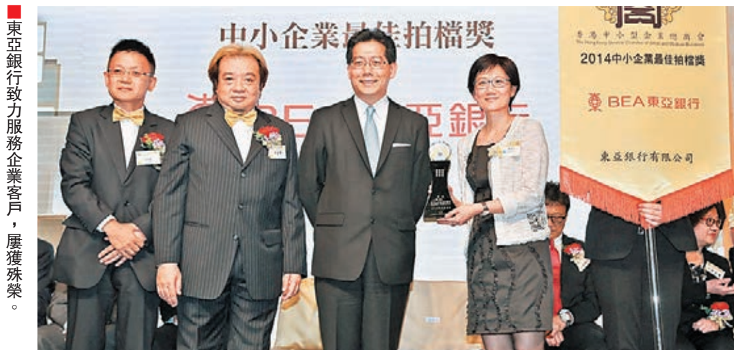
東亞銀行致力服務企業客戶，屢獲殊榮。

展望未來，該行還會加強香港、內地及海外網絡的合作，以及密切注視市場發展及客戶需要，迅速作出產品、服務或流程的優化，繼續成為企業客戶營商的首選銀行。此外，亦會積極透過優化分行網絡及業務運作，即如引進電子交易平台及電子支付服務，為電子商務創造網上商機。