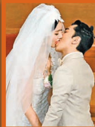
祖藍與亞男開閩閩激情感吻。