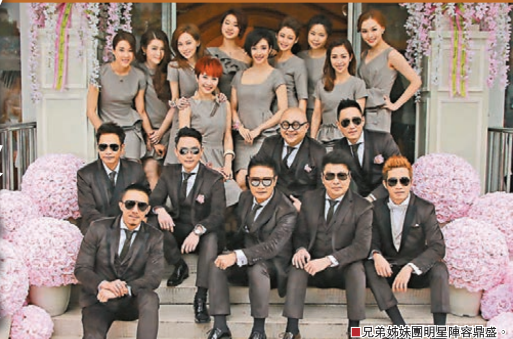
兄弟姊妹團明星陣容鼎盛。