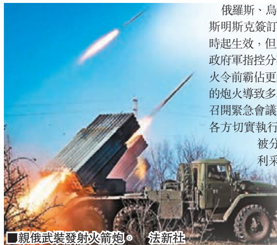
親俄武裝發射火箭炮。

俄羅斯、烏克蘭、德國和法國早前在白俄羅斯斯莫利斯克簽訂的停火協議，於香港時間今晨6時起生效，但烏克蘭東部昨日繼續烽煙四起，政府軍指控分離分子發動猛烈攻擊，企圖在停火令前霸佔更多地盤，分離分子則反指政府軍的炮火導致多名平民死傷。聯合國安理會今日召開緊急會議商討烏東局勢，俄羅斯動議要求各方切實執行停火令。