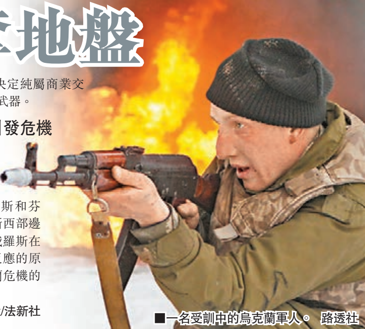
一名受訓中的烏克蘭軍人。