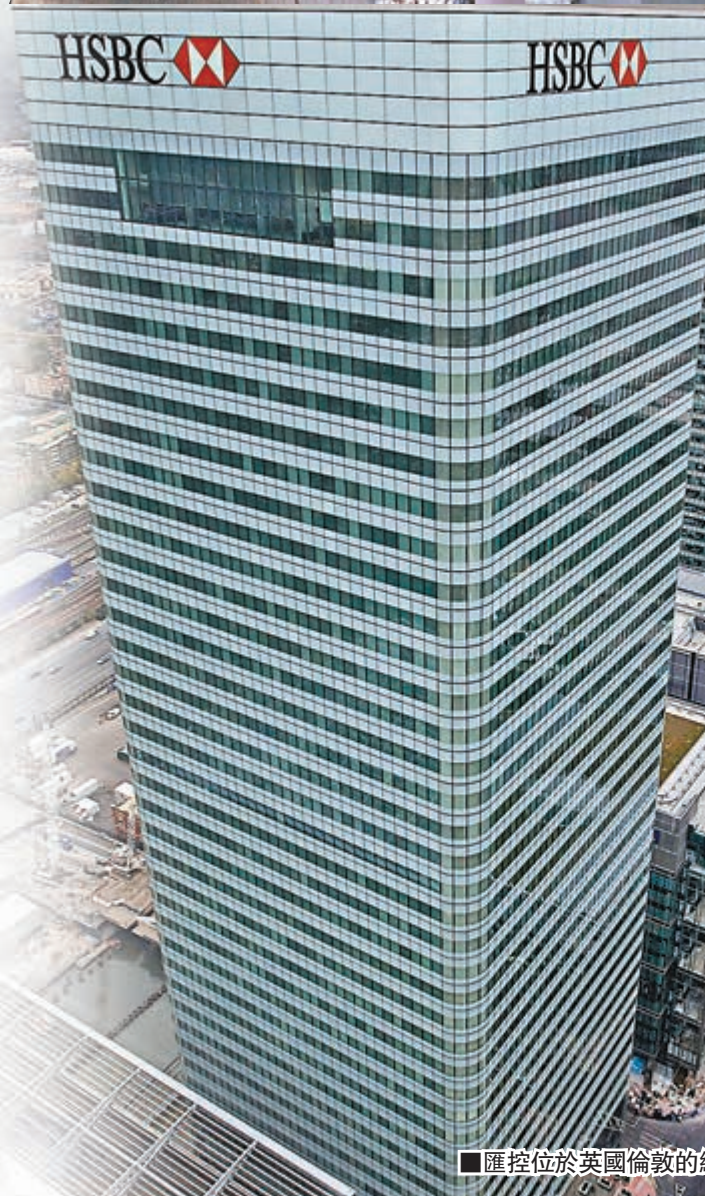
匯控位於英國倫敦的總部。

匯豐銀行瑞士分行被揭發協助客戶逃稅的醜聞持續發酵，更多內情陸續曝光。傳媒公開揭密者早於2008年已向英國稅務及海關總署(HMRC)報料的電郵紀錄，證明當局早知匯控協助逃稅，卻一直未有跟進。英國矢口否認收過有關電郵，財政部更表示向法國索取逃稅客戶資料後，對方嚴格限制資料用途，阻撓調查，法國反駁指控。