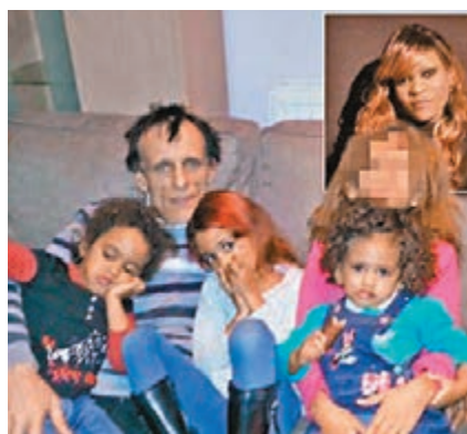
三名被燒死的女童，小圖為姆博。網上圖片