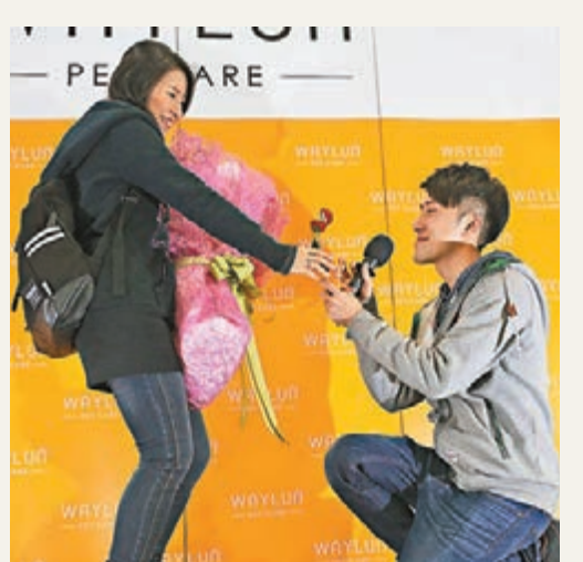
■愛狗男在舞台求婚。

能斷守終身的情人,必定共同經歷不少風雨,曾經離離合合的鍾先生及太太,昨日終於花開結果。鍾太太表示,「我們拍拖4年多,也曾經歷分開再復合,但拍拖的日子每天也很難忘。」站在太太身旁的鍾先生則指,「我會一生一世愛你。」令太太露出幸福滿溢的笑容,更笑言每年也要收一隻戒指。