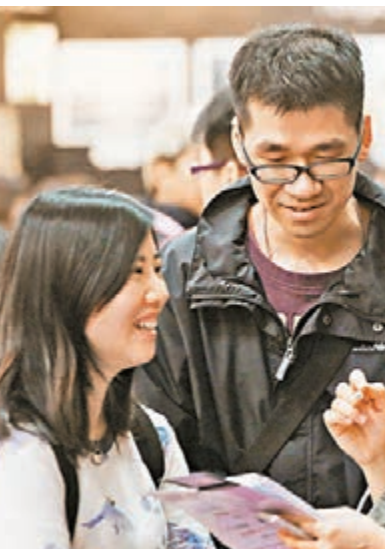
■李先生與女友不打算擺酒,寧願用多點錢拍婚紗照。