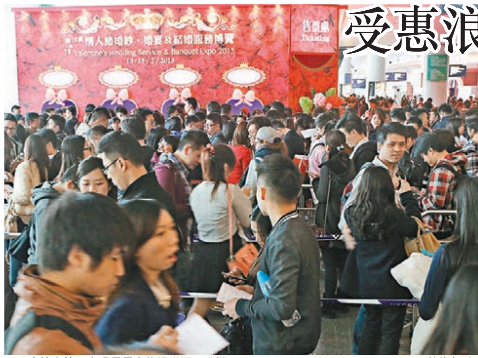
■盛逢情人節,出現長長人龍排隊買票進場。

餐才上班。二人拍拖4年,張先生去年成功求婚,今年情人節沒買昂貴禮物,但體貼近視的女友,送贈眼鏡,女方亦感滿意,他們指情人節消費特別貴,「不想被『割』」,而且心連心的兩個人,「每天都是情人節」。