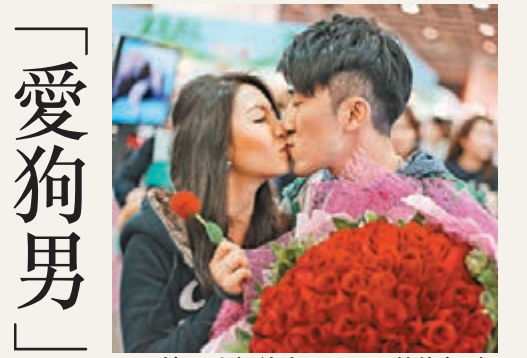
■深情一吻訂終身。

「愛狗男」舞台求婚：希望你當我係寵物 特稿 收下玫瑰,套上戒指,從此你的名字,我的姓氏。負責舉辦寵物用品博覽的公司員工Mark,昨日藉詞邀女友到場幫忙,在會展舞台上「突擊」求婚,女方驚喜感眼濕濕,欣然答應,成為首對在寵物展上成功公開求婚的情侶。