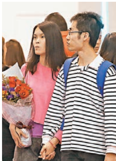
■黃先生與女友手牽手到博覽會參閱資料。

每對準新人對辦酒席的想法不同,但拍攝一輯甜蜜婚照則是每對準新人的基本要求。李先生與女友拍拖5年,今年計劃結婚,二人即場購買台灣拍婚紗套餐,合