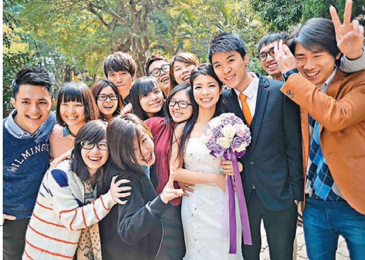
▶梁生梁太是青梅竹馬的幼稚園同學。

香港文匯報訊(記者 葉佩妍)簽過婚書、讀過誓言,兩人從此白頭到老。為了製造難忘的結婚紀念日,不少情侶都選擇於2月14日情人節註冊結婚。根據入境處的資料顯示,今年全港共有207對新人打算於昨日登記「拉埋天窗」。有新人表示,在情人節註冊結婚別具意義,所以特意於3個月前在網上預約,希望與另一半為情人節多加一重意義。