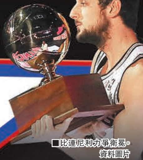
■比連尼利力爭衛冕。