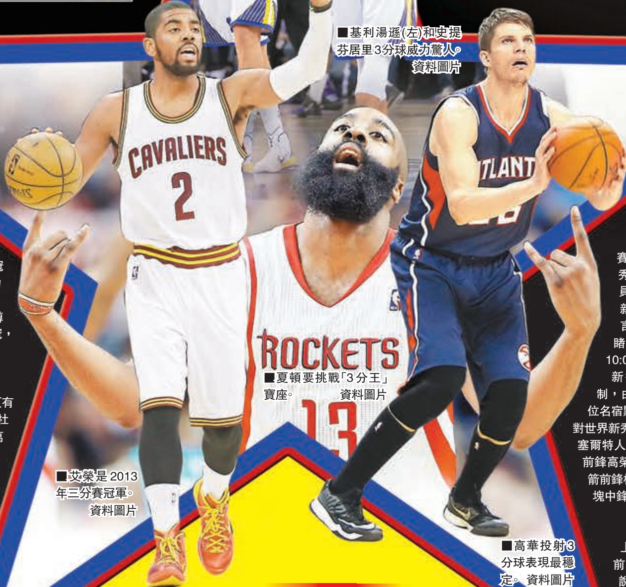
■夏頓要挑戰「3分王」寶座。資料圖片