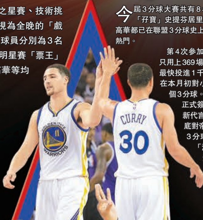
■基利湯遜(左)和史提芬居里3分球威力驚人。資料圖片