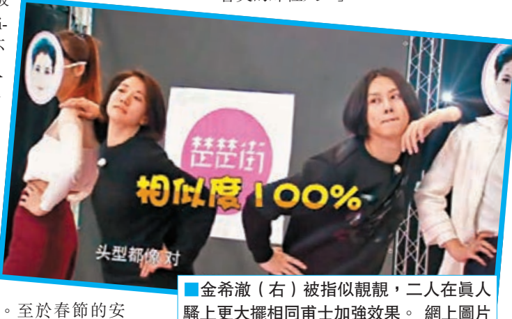
金希澈(右)被指似靚靚，二人在真人騷上更大擺相同甫士加強效果。

對於粉絲一直關心的個人感情問題，阿余也透露了自己選男朋友的標準：「我覺得選男朋友能溝通就好，大方向的想法差不多，我一看見他就會笑的那種人。」