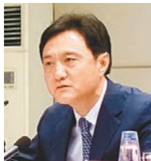
■環境保護部副部長翟青。

香港文匯報訊(記者 江鑫嫻 北京報道)環境保護部副部長翟青昨日表示,京津冀、長三角、珠三角等區域空氣質量預警中心已基本建成,可實現48小時空氣質量預報和後3天的預測分析。同時,他坦言,各地環境質量依然嚴峻,京津冀仍是污染最重的區域。根據測算,污染物總量同比下降3至5成,環境質量才有明顯的提升。