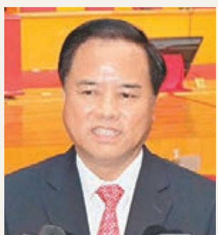
■海南新省長劉賜貴。

香港文匯報訊(記者 何政、安莉 海南報道)昨日閉幕的海南省五屆人大三次會議選舉劉賜貴為海南省長。劉賜貴在當選後發表的講話中表示,要發揚敢闖敢試、敢為人先的特區精神,創建更具活力的體制機制,構建海南21世紀海上絲綢之路橋頭堡。