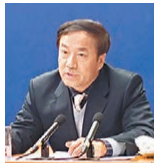
■住房和城鄉建設部副部長齊驥。

務,預計今年「兩會」也不會例外。齊驥表示,根據計劃,今年將新開工建設保障性安居工程700萬套,基本建成480萬套。同時,今年以國家開發銀行為主的金融機構,還將為棚戶區改造提供更多資金支持,而中央財政也會對保障性安居工程的中央補助給予更多支持。