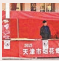
■天津煙花爆竹零售點已失去了往年的火爆景象。

香港文匯報訊(記者 李欣 天津報道)今年春節是天津最嚴「限炮令」實施後的首個春節。農曆臘月二十三即「小年」,天津市煙花爆竹零售點開售,相比傳統鞭炮,今年環保型鞭炮更受青睞。傳統煙花爆竹所帶來的安全隱患、大氣污染、噪聲污染等已成社會公害。去年12月1日,天津市新修訂的《煙花爆竹安全管理辦法》正式實施,規定外環線以內地區為「限時限放區域」。違規不聽勸阻者將處以100元(人民幣,下同)以上、500元以下罰款。