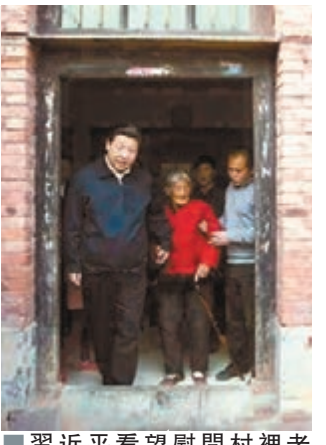
習近平看望慰問村裡老人。

如今，梁家河村已經擺脫了往年的貧困面貌。由於地處黃土高原，屬於蘋果優生區，目前村裡栽植蘋果超過200畝。近年來，梁家河村以蘋果為特色產業，經濟發展得紅紅火火，農民人均純收入達到人民幣7,300元。去年，梁家河村入選全國一村一品示範村，是延安市唯一入選的村鎮。