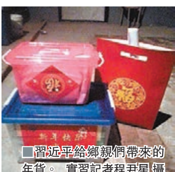
習近平給鄉親們帶來的年貨。

而據記者了解，習近平到訪梁家河村後，引起轟動的還不止梁家河村的村民，在延安市裡，百姓們也期待着能與習主席見上一面，有人甚至自發到中共中央西北局紀念舊址外排隊等待。