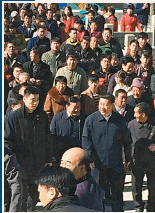
習近平在梁家河村。網上圖片

2013年，延安遭遇百年不遇的洪水，梁家河村也受了災。2014年1月，梁家河村黨支部和村委會給習近平寫信匯報村上經濟發展及災後重建情況。5月5日，習近平給梁家河村覆信稱，「2013年夏天，延川遭受了嚴重的持續降雨災害，我一直惦记着村裡的鄉親們……我說過，小康不小康，關鍵看老鄉。讓村裡鄉親們和全國廣大農民一起早日過上小康生活，一直是我的心願。2014年，村裡制定了發展計劃。希望你們帶領鄉親們腳踏實地、真抓實幹，努力把日子過得越來越紅火，把村子建得越來越美麗。向全村鄉親們問好。」