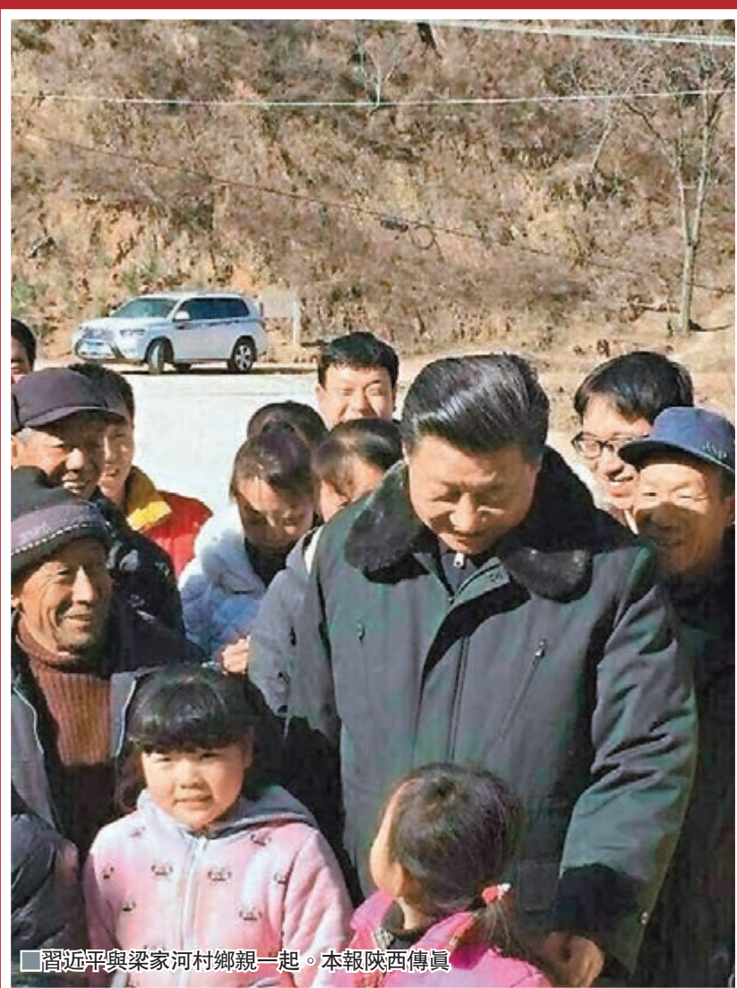
習近平與梁家河村鄉親一起。