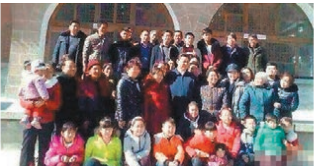
習近平與梁家河村張姓家族的合影。