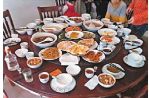
梁玉明家招待習近平夫婦的家宴。