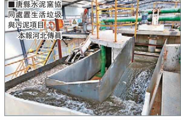
■唐縣水泥廠協同處置生活垃圾與污泥項目。本報河北傳真

另有水泥廠廠長直言：「廠子都是自己一磚一瓦建起來的，數百萬的環保設備，數千萬的投資砸了進去，心疼啊！『市場之手』比『政府之手』更有效果，淘汰不淘汰，應該由市場說了算。」談及西部轉移和走向海外，陳總表示，知道省裡鼓勵企業走出去，但主要有「離家三里外鄉人」的顧慮。