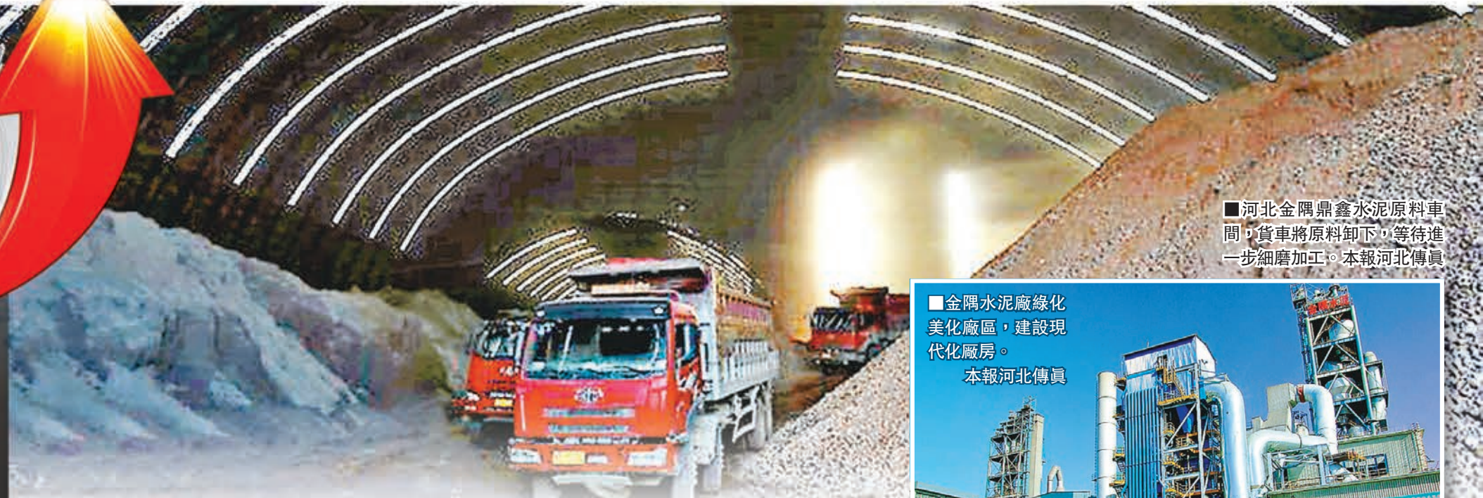
■河北金隅鼎鑫水泥原料車間，貨車將原料卸下，等待進一步細磨加工。