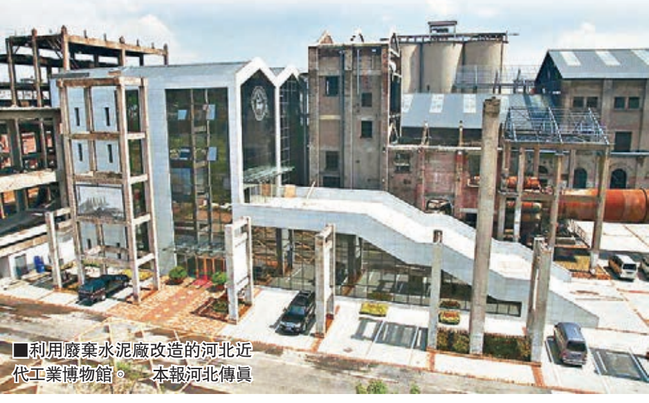
■利用廢棄水泥廠改造的河北近代工業博物館。本報河北傳真