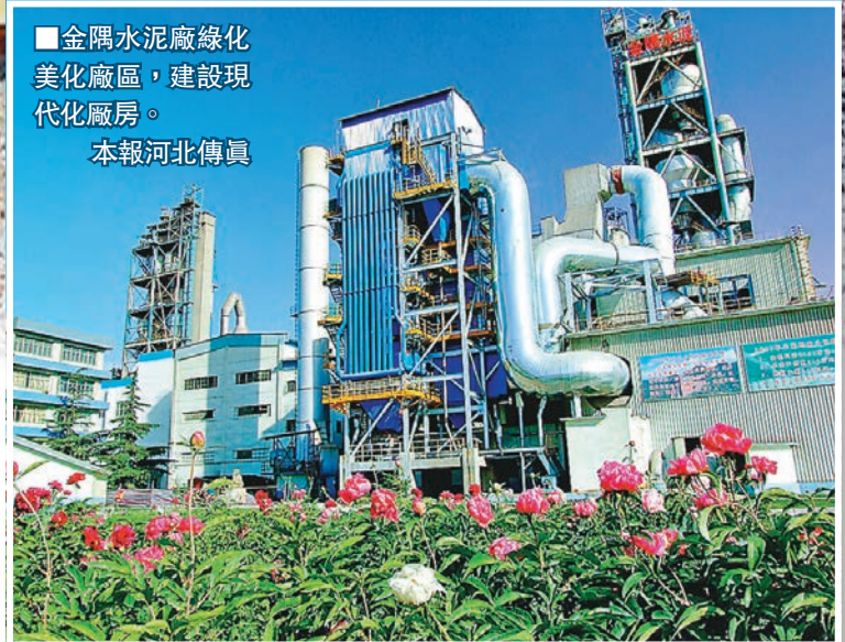
■金隅水泥廠綠化美化廠區，建設現代化廠房。