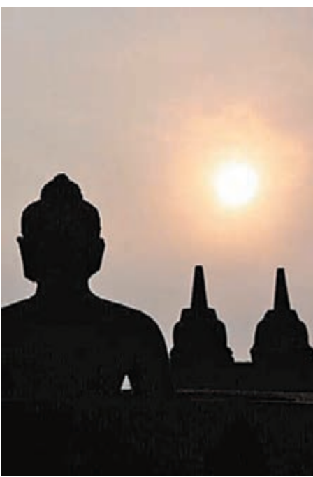
■《足足五千年》書內插圖。