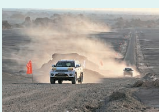
■絲綢之路萬里行車隊穿越敦煌雅丹地貌。

作者簡介：胡斌，男，媒體人、作家、攝影家，先後供職於人民日報、光明日報，業餘從事攝影活動20餘年，著有新聞作品集《機會擁抱中國》、攝影作品集《多彩的世界》等。