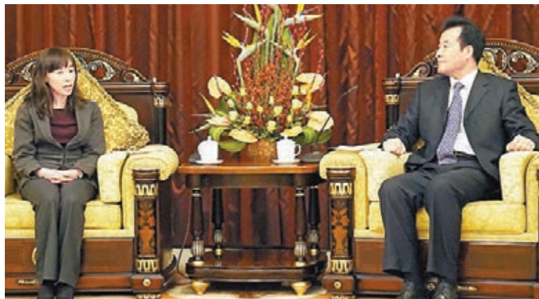
雲南省副省長高樹勳（右）會見香港政制及內地事務局副秘書長李佩詩（左）。

香港文匯報訊（記者 芮田甜 昆明報導）由香港政制及內地事務局副秘書長李佩詩率領的特區政府官員團近日赴雲南訪問，期間，雲南省副省長高樹勳在昆明震莊迎賓館會見李佩詩一行，高樹勳希望滇港兩地加強高層互訪、投資貿易與國際市場、特色農業、會展服務、旅遊文化五大方面的合作。李佩詩回應稱，香港將與雲南共謀「一帶一路」經濟帶，拓展東南亞、南亞市場。