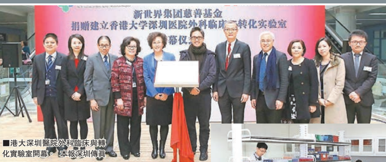
港大深圳醫院外科臨床與轉化實驗室開幕。 本報深圳傳真

香港文匯報訊（記者 郭若溪 深圳報導）港大深圳醫院外科臨床與轉化實驗室近日正式開幕，至此，港大外科學系在港深兩地擁有兩個「臨床與轉化實驗室」。作為港大外科在深研的科研基地，該「臨床與轉化實驗室」將主要進行外科常見的原發性肝癌、食道癌、大腸癌等高發腫瘤的臨床研究，研發治療腫瘤的新技術，為建立個人化與聯合治療提供新的依據，並開發新型治療的動物實驗（轉化研究），加快科研成果向臨床實踐轉化。