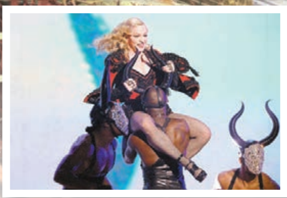
■ 麥當娜跳上男舞蹈員身上，表現狂野。