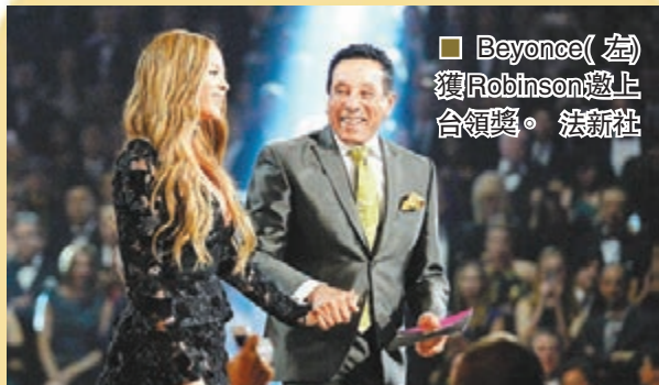
■ Beyonce(左)獲Robinson邀上台領獎。