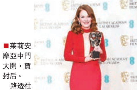
■茱莉安摩亞中門大開，賀封后。