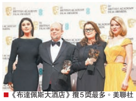
■《布達佩斯大酒店》攬5獎最多。

不足兩周後，國際影壇盛事奧斯卡頒獎禮便舉行，而昨日則有堪稱奧斯卡風向球之一、外號「英國奧斯卡」的英國電影和電視藝術學院獎(BAFTA)頒發第68屆各個獎項，結果早已凱旋多個電影頒獎典禮的《我們都是這樣長大的》(Boyhood)拿下最佳電影及最佳導演等3個獎，跟橫掃全場最多5個獎項的《布達佩斯大酒店》(The Grand Budapest Hotel)互相輝映。深受戲迷追捧的《飛鳥俠》(Birdman)則繼金球獎慘敗後，只能贏得一個攝影獎，但已較《解碼遊戲》(The Imitation Game)捧蛋來得幸運。