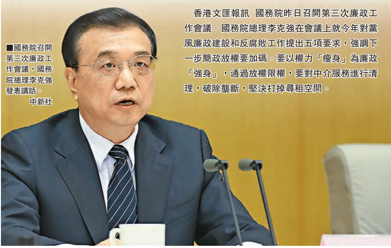
國務院召開第三次廉政工作會議，國務院總理李克強發表講話。

三是勤政有為，推動重大決策落實。領導幹部要敢於擔當，主動作為，善謀善為，幹事創業謀發展。重大任務要明確分工，逐級簽訂目標任務責任書，立下「軍令狀」。重點工作要嚴格時限，確保完成，說到做到，不放空炮。決策部署要督查落實，認真開展督查落實專項行動，確保政策落地生根。對懶政庸政怠政、不作為的要嚴肅問責，對不敢抓不敢管、尸位素餐、碌碌無為的幹部，堅決採取組織措施。重實績、講實效，讓大批有能為的「千里馬」競相馳騁。