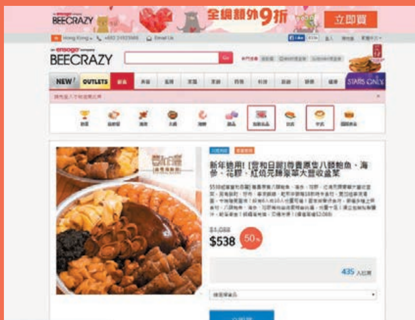
團購網推出的盆菜，材料一點也不失禮。

Groupon上亦有賀年糕點優惠，以128元就可購買原價270元的鳳城酒家年糕、蘿蔔糕各1.5斤，優惠券使用期至本月15日，仍未購買糕點的各位，記得把握最後機會。