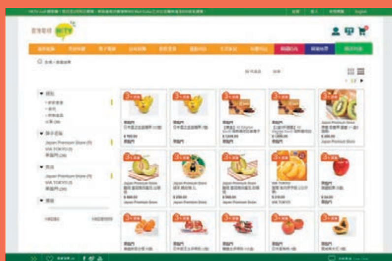
香港電視的購物平台設有不少日韓直送產品。

港視網購大派利是推廣 說到本地網購網站，不可不提最近在港開業的香港電視網購平台。港視向123萬名用戶派出每人100元的大利是，貨品更主張為正價正貨，拒絕水貨假貨。該網購平台設有不少日韓直送產品，如日本士多啤梨、賀年禮盒等，雖然價錢上仍可能較上述的網站貴，但好處是買滿400元可免運費於翌日送到府上，且可扣減100元利是，變相有折扣優惠，一試無妨。