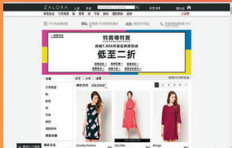
訂閱ZALORA的電子報可獲100元電子優惠券。

立春已過，春節快到，華人社會家家戶戶趕着辦年貨準備團年飯。惟港人出名日做夜做成日OT，實在很難空出時間到海味街、年貨店、服裝店等掃貨，更遑論四圍格價，看看哪家鋪頭折扣優惠比較多。近年興起的網上購物就正好滿足到繁忙都市人的需要，安坐家中、辦公室、咖啡店，甚至在交通工具內仍可輕鬆辦好年貨、添置新裝，省時省力之餘，最重要是可以省錢。年關將至，本報特意網羅中、日、韓、美、英等多個知名網購網站，為小市民提供一點參考意見，挑選出平靚正的心水貨品。