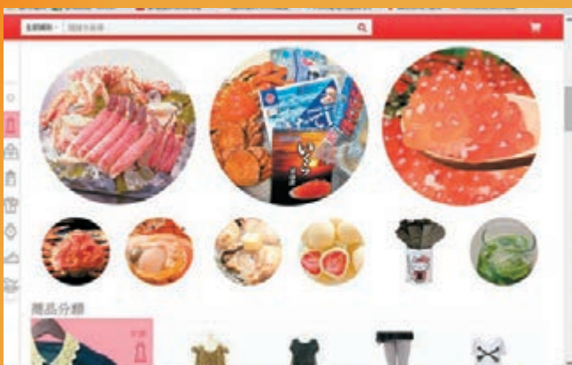
樂天網現有提供中文界面。

近期日圓跌至6.5算，實屬鍾情日貨港人的一大佳音，日本「樂天網」更旋即成為港人網購的天堂。日本和菓子禮盒、白之戀朱古力、年輪蛋糕等均是送禮佳品，比起一般賀年糖果、餅乾更特別更吸引人。最重要的是，日本「樂天網」已經推出中文版網站，小市民不用再為不諳日文感到困擾，網站亦不時會推出本地信用卡優惠。