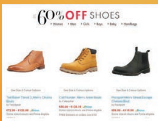
Amazon不少鞋款推出4折優惠。