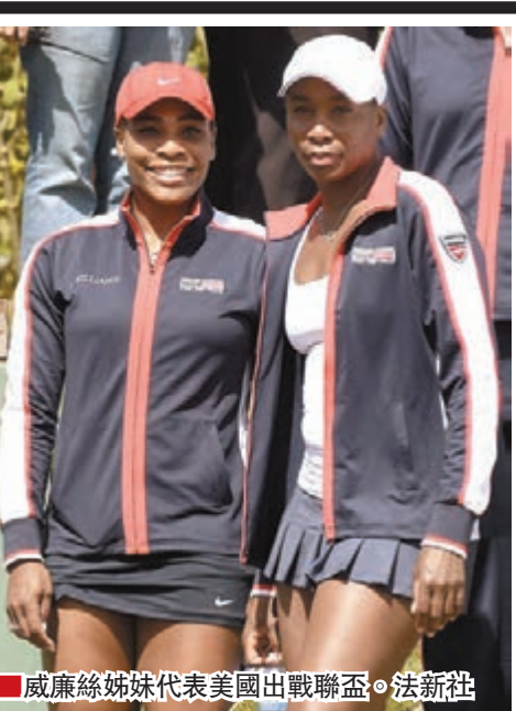
■威廉絲姊妹代表美國出戰聯盃。