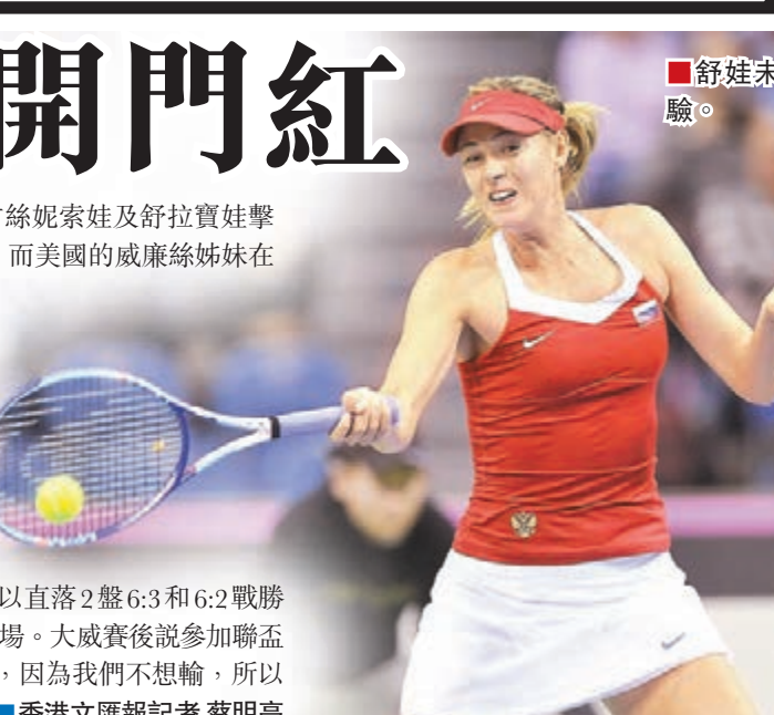
■舒娃未受到考驗。

聯合會盃世界組賽事上周六展開，俄羅斯在客場憑藉古絲妮索娃及舒拉寶娃擊敗波蘭的拉雲絲卡「姊妹花」，目前在總場數以2:0領先；而美國的威廉絲姊妹在世界組第二組則輕取阿根廷的一對對手，同樣領先2場。面對世界排名第8位的拉雲絲卡，古絲妮索娃力戰3盤始以6:4、2:6和6:2的盤數取勝，而舒娃遇上拉雲絲卡的妹妹則相對輕鬆，以6:0和6:3的盤數過關，為俄羅斯取得2場領先優勢。舒娃賽後說：「比賽開始後我打得很強勢，雖然第2盤稍有放鬆，但總的來說我很滿意今天能以2盤拿下比賽。古絲妮索娃能贏下首場我很開心，她的勝利給我很多信心。」