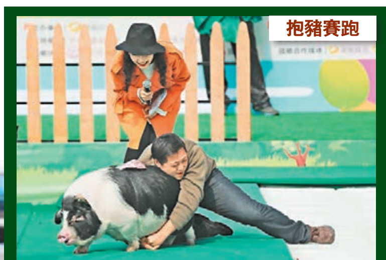
抱豬賽跑 昨日，一場抱花豬冰面賽跑活動在湖南長沙舉行，挑戰者需在2分鐘內抱上花豬穿越20.15米的冰雪賽道，且在終點親吻花豬方可獲勝。當日，有挑戰者摔倒後被花豬拖行，場面十分滑稽。