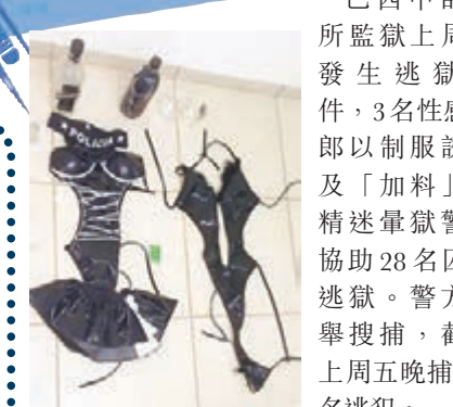
辣妹使用的制服「道具」及加料威士忌。

巴西中部一所監獄上周四發生逃獄事件，3名性感女郎以制服誘惑及「加料」酒精迷暈獄警，協助28名囚犯逃獄。警方大舉搜捕，截至上周五晚捕獲8名逃犯。事發於凌晨3時，性感女郎帶着數支威士忌，在新穆通公共監獄外要求入內聊天及喝酒，成功說服獄警離開，帶她們到休息室。女郎在酒中落藥，獄警飲後不省人事，她們便取鑰匙打開囚室大門。逃犯從武器庫偷走2支手槍及3支步槍後，由監獄正門離開。3名獄警早上被發現赤裸躺在休息室，被鎖上手銬，警方在現場發現性感內衣及警察制服，獄警的裸照其後在網上瘋傳。據報其中一名女郎的男友是逃犯之一，逃獄計劃正是由他策劃。