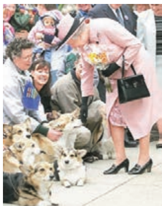
英女王最愛的哥基犬，年輕人認為只有長者才養，以致需求大跌。

英女王最寵愛哥基犬，不少重要場合均見牠陪伴在側，不過這種英國王室名犬近年被指過氣，去年全國登記數目更跌至不足300隻，首次列入「脆弱品種」名單。