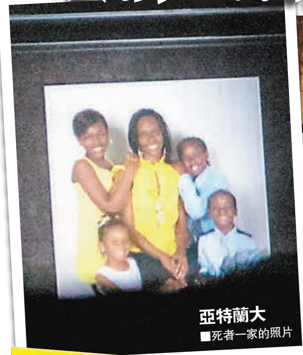
亞特蘭大 死者一家的照片