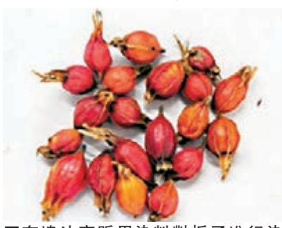
有違法商販用染料對梔子進行染色。

據央視報道，暗訪中發現，河南禹州馬路邊、停車場等開放場所，隨意攤開晾曬中藥材現象十分普遍，不僅垃圾充斥其中，其間還夾雜動物糞便，衛生條件突破底線。不僅如此，一些商販為了牟取暴利，還對銷售的