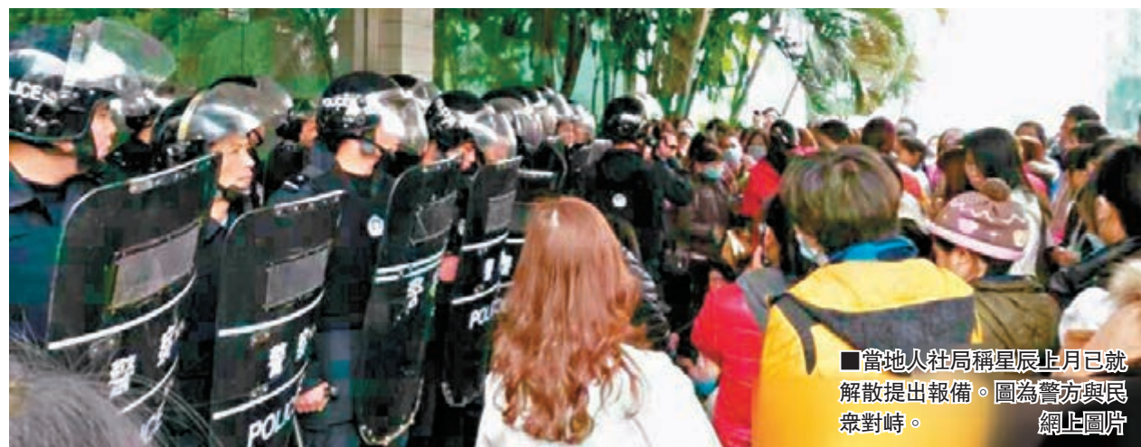
當地人社局稱星辰上月已就解散提出報備。圖為警方與民眾對峙。網上圖片