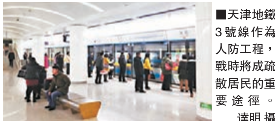
天津地鐵3號線作為人防工程，戰時將成疏散居民的重要途徑。

據悉，人防工程也叫人防工事，是指為保障戰時人員與物資掩蔽、防空指揮、醫療救護而修建的地下防護建築，以及結合地面建築修建的戰時可用於防空的地下建築。