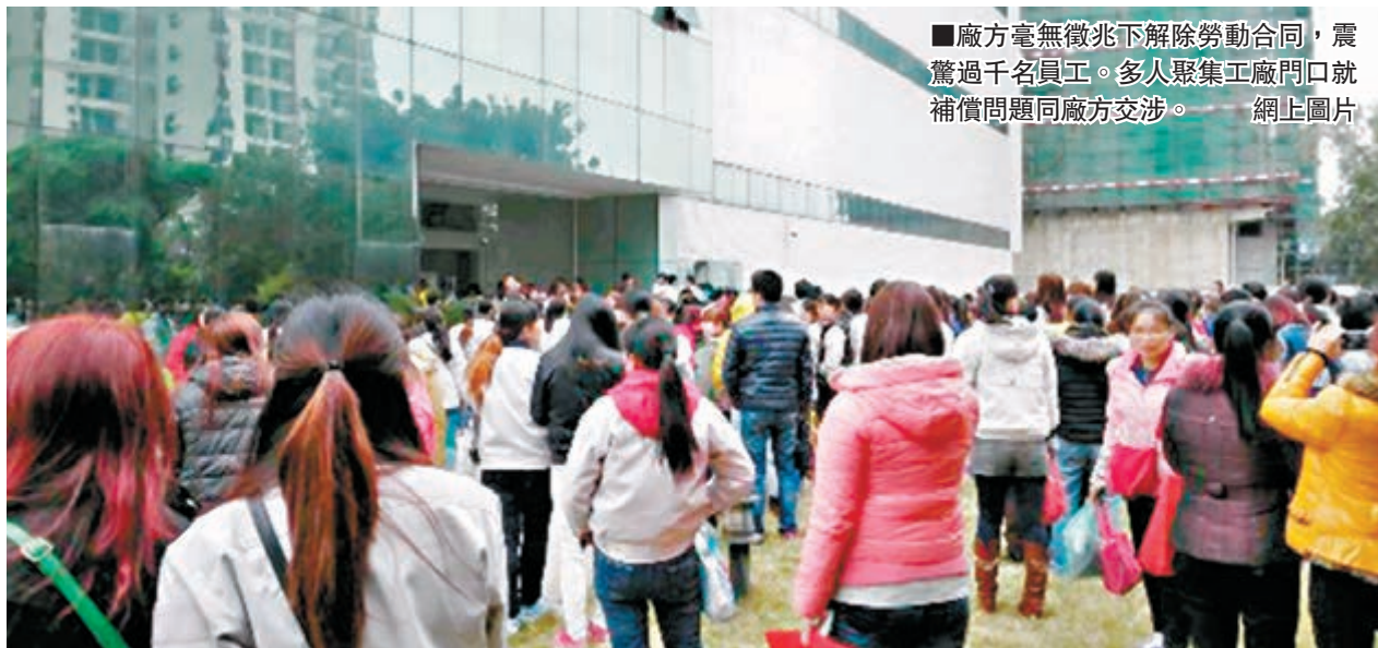
廠方毫無徵兆下解除勞動合同，震驚過千名員工。多人聚集工廠門口就補償問題同廠方交涉。

2011年，由於不滿薪酬等問題，西鐵城在深州的代工廠1,000多工人停工；2013年2月，西鐵城宣佈將分設子公司西鐵城鐘錶的手錶製造業務部門為獨立公司，同時合併集團內生產手錶零件的5家公司，當時公司計劃在數年內裁減整個集團日本國內約8,750名員工中的約一成。據了解，由於與瑞士高檔品牌手錶的競爭日趨激烈，西鐵城當時希望通過重組手錶業務來提高生產效率。