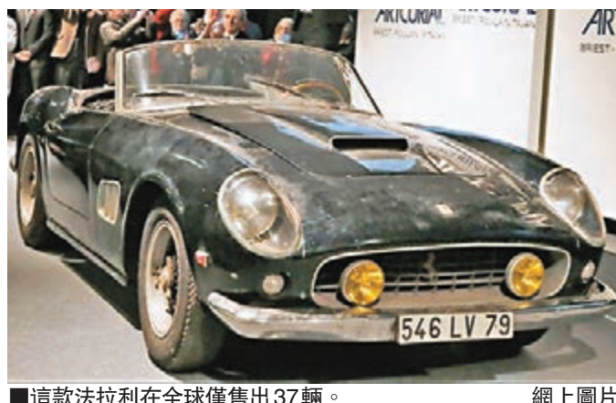
■這款法拉利在全球僅售出 37 輛。

一輛 1961 年出產的法拉利 250GT SWB California Spyder，前日在巴黎拍賣會，由一匿名競投者透過電話出價 1,630 萬歐元(約 1.4 億港元)投得，創下該款車在拍賣市場的新紀錄。