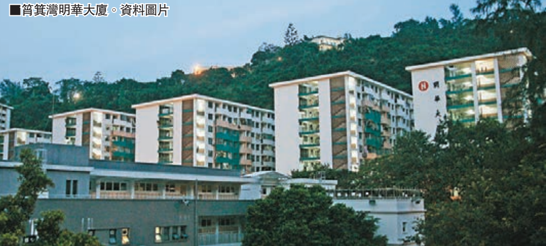
■筲箕灣明華大廈。

另外，長策會早定出未來10年供應20萬個公屋單位的目標，鄔滿海指根據初步數據，前5年未必可以平均每年興建2萬個單位，相信之後5年可以追回進度，但要視乎土地供應，這方面需要得到社會共識。對有人建議容許未補地價屋出租部分房間，鄔滿海認為符合善用房屋資源的精神，可以深入考慮，但承認行政上可能造成困難，包括如何區分哪些房間可以出租等。