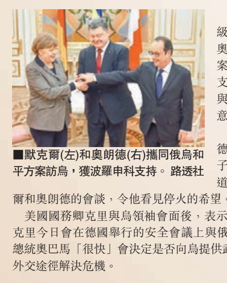
默克爾(左)和奧朗德(右)攜同俄烏和平方案訪烏，獲波羅申科支持。