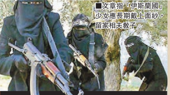
文章指「伊斯蘭國」少女應長期戴上面紗，留家相夫教子。