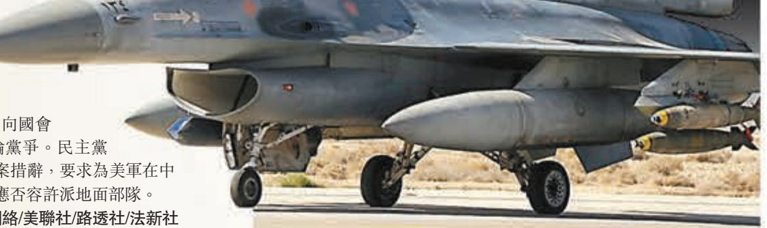
約旦前日出動30架戰機空襲ISIL。