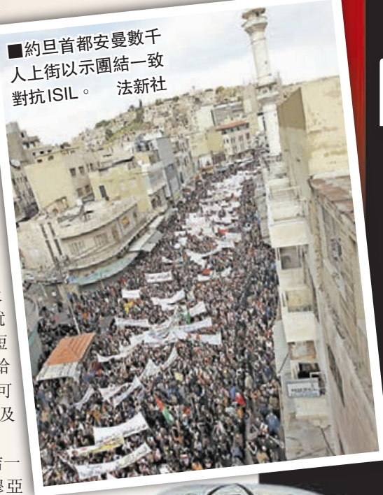
約旦首都安曼數千人上街以示團結一致對抗ISIL。