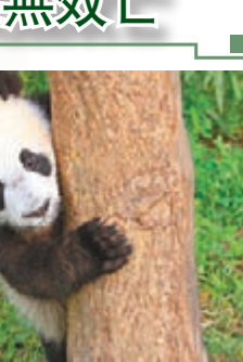
「鳳凰」小時候的照片。

陝西省珍稀野生動物搶救飼養研究中心昨日透露,患犬瘟熱病的大熊貓「鳳凰」,在經過35日的搶救治療後,於4日因臟器衰竭導致呼吸困難死亡。目前,該中心尚無新增大熊貓感染病例。 2009年8月出世的雌性大熊貓「鳳凰」,去年12月26日被確診染病,當日即被隔離,並按專家組會商的方案進行治療。今年1月2日,「鳳凰」出現抽搐等神經症狀,1月8日陷入昏迷、情況危殆。之後,治療人員採用插胃管輸送食物、藥品,促使其機體功能恢復。2月3日其體溫升高,呼吸困難,延至2月4日中午12時40分宣告不治。 另有1隻早前確診及3隻疑似患病的大熊貓,經救治後目前血液檢測結果已轉為陰性。 記者 熊曉芳 西安報道