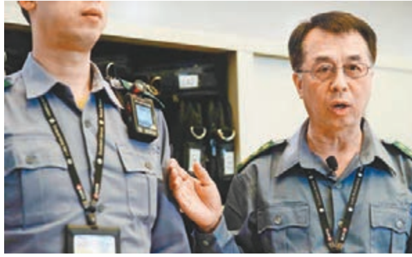
港鐵介紹上水站人流管理措施和附例特檢隊試用「隨身攝」新裝備。

香港文匯報訊(記者 羅繼盛)港鐵上水站過往曾發生乘客與港鐵職員口角,甚至職員被打等衝突事件。港鐵將於下周一一起引入3部隨身攝錄器,供在上水站執勤