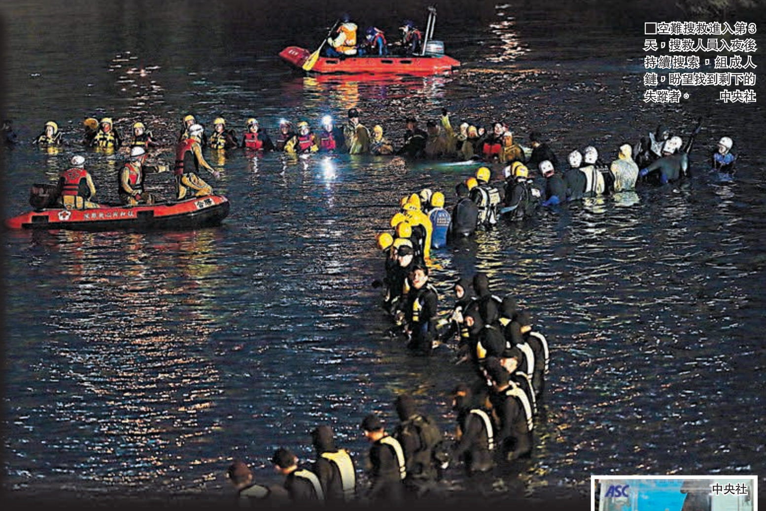
空難搜救進入第 3 天，機救人員入夜後持續搜索，組成人鏈，盼望找到剩下的失蹤者。

台灣「民航局」指出，近期將要求復興提出計劃，儘快對機師進行兩階段強化管理，包括第一階段基本知識的筆試、口試，以及第二階段模擬機測試。復興航空表示，近期將提出訓練計劃送「民航局」審核，另因連續發生 2 次飛安事件，痛定思痛，未來將聘請世界級飛安專家團隊，替復興做為期一年飛安體檢及改善。