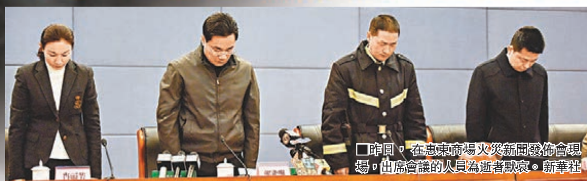
昨日,在惠東商場火災新聞發佈會現場,出席會議的人員為逝者默哀。

這場大火的撲救從5日13時51分持續到昨日上午8時,時間長達18小時。記者了解到,在事發過後,消防員曾多次進行強攻破拆,但因牆體太厚,以及建築物燃燒後產生的毒煙氣,導致消防員一度無法攻入救援。