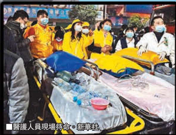
醫護人員現場待命。