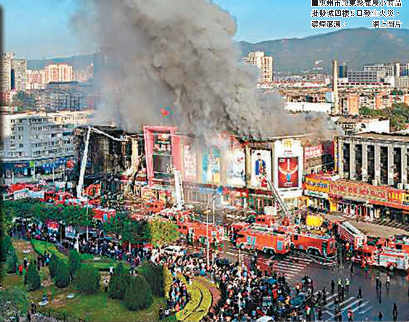
惠州市惠東縣義烏小商品批發城四樓5日發生火災,濃煙滾滾。網上圖片