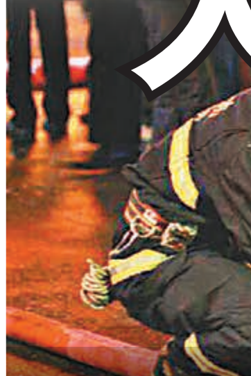
已確認遇難者名單

深圳龍崗「9·20」大火釀44死 2008年9月20日,深圳市龍崗無牌經營的「舞王俱樂部」發生重大火災事故,造成44人死亡,80餘人受傷。火災原因是舞王俱樂部大廳演員表演燃放煙火,導致天花板着火斷電所致,當晚該俱樂部內約有近千人,整個俱樂部只有兩條消防通道,且通道狹窄並堆有雜物,死者多為濃煙煙熏、踩踏致死。