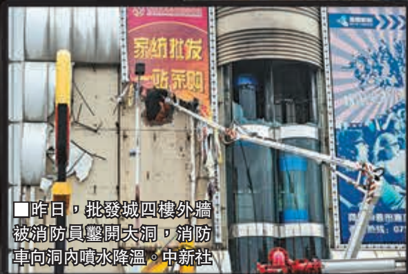
昨日,批發城四樓外牆被消防員擊開大洞,消防車向洞內噴水降溫。