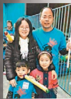
疑在事故中死亡的一家四口,父母均為老師。本報惠州傳真

香港文匯報訊 (記者李薇及綜合報道) 廣東惠州市惠東縣義烏小商品批發城四樓5日13時51分發生火災。官方昨日上午10時召開新聞發佈會並通報稱,火災共造成17人死亡,包括一名14歲香港籍女生。截至昨日上午8時,現場消防官兵8次強攻,救出5人,4名消防員受傷,其中1人重傷。公安機關已控制9名相關責任人。警方查明,火災是一名9歲四川籍男童在商場四樓4040店舖前用打火機玩火,引起貨品燃燒並蔓延,已將男孩羅某帶回調查。