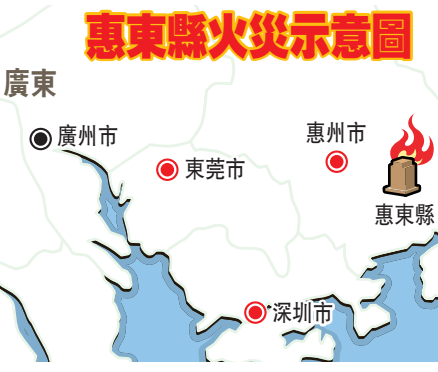
惠東縣火災示意圖

因4樓已大部分過火,經建築、結構專家實地勘察後認為,該商場地存在坍塌風險。對於該事故是否存在人員失職瀆職行為,在昨日上午的發佈會上,惠東縣安監局長古遠光坦言,今年1月該局曾對該商場進行18次檢查,發現部分位置存在消防隱患。「消防大隊曾到現場進行檢查,發現通道存在堵塞的問題。安監部門有要求商場限期整改,但整改期限還未到。」