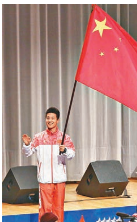
世界大學生冬季運動會昨日開幕，中國代表舉旗向觀眾致意。