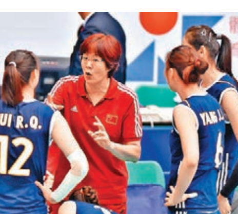
郎平（紅衫）受惠於女排聯賽年輕化，今後可有更多人用。資料圖片

雖然廣州恒大淡出排球，但本賽季的全國女排聯賽卻出現近年來少見的激烈情況，進入 8 強的球隊實力更均衡，沒有一支能言必勝。這與步入成熟期的老將挑起大樑有關，但各隊的新人表現更搶眼，甚至能決定球隊最終的成績走向，新人大量湧現也給中國女排主教練郎平提供了更多選擇。 在郎平上月底公佈的新一屆中國女排大名單中，除了二傳外，其他各位置都出現不少新人。其中王雲蕓、鄭益昕、張曉雅、王唯滢、林莉和王夢潔都是首次入選，而像袁心玥、張常寧雖入選過國家隊，但也可算是新人，她們無一不是在各自球隊表現出色的球員。