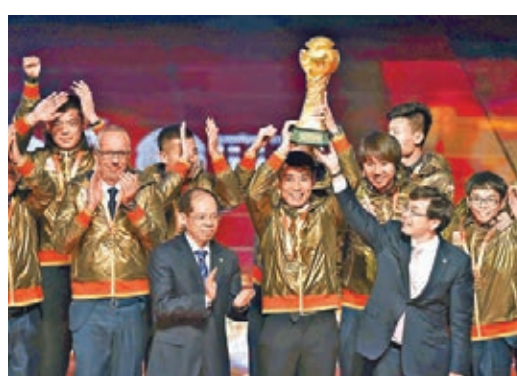
恒大放眼將來，目標之一是今年再奪亞冠盃。資料圖片