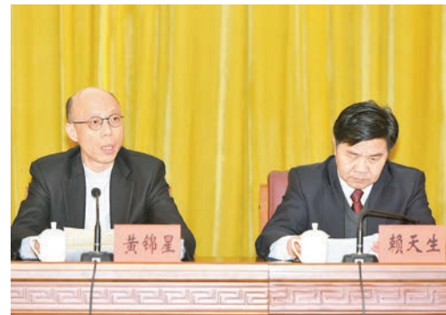
■第六屆「粵港清潔生產伙伴」標誌計劃頒授儀式於廣州舉行,黃錦星於儀式上致辭。

用戶只要利用手機定位功能,便能搜尋附近油站的位置及距離,以及該油站提供的燃油種類、價錢和優惠,以至有否提供洗手、汽車美容和洗手間等設施。程式亦有多項個人化功能,包括可設立最多3張個人油卡資料庫,供用戶按各自優惠選擇適合的油站。用戶亦可在程式上記錄入油支出和車輛里數等資料,以便作好預算。市民可於App Store或Google Play Store下載有關軟件。