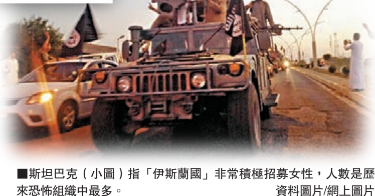
■斯坦巴克(小圖)指「伊斯蘭國」非常積極招募女性，人數是歷來恐怖組織中最多。