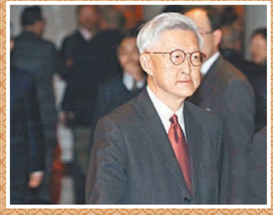
終審法院前任首席法官李國能出席酒會