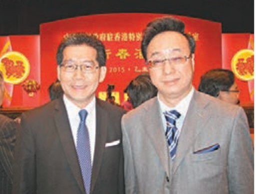
商務及經濟發展局局長蘇錦樑(左)與上海市 政協常委屠海鳴在酒會上合照。