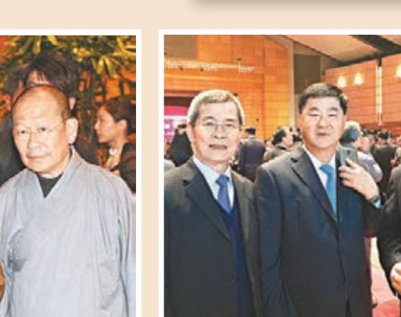
(左二)等在酒會上。