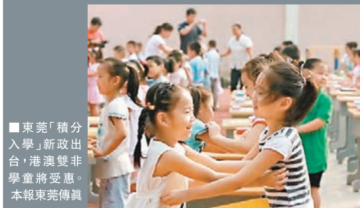
■東莞「積分入學」新政出台，港澳雙非學童將受惠。 本報東莞傳真

香港文匯報訊（記者 何花 東莞報道）東莞積分入學政策首次面向港澳籍學生開辦。東莞市政府在2日舉行的常務會議上通過了《2015年東莞市義務教育階段新莞人子女積分制入學積分方案》（簡稱《方