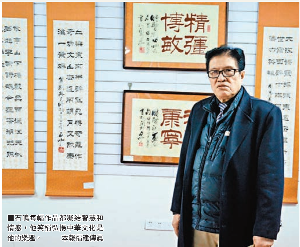
■石鳴每幅作品都凝結智慧和情感，他笑稱弘揚中華文化是他的樂趣。