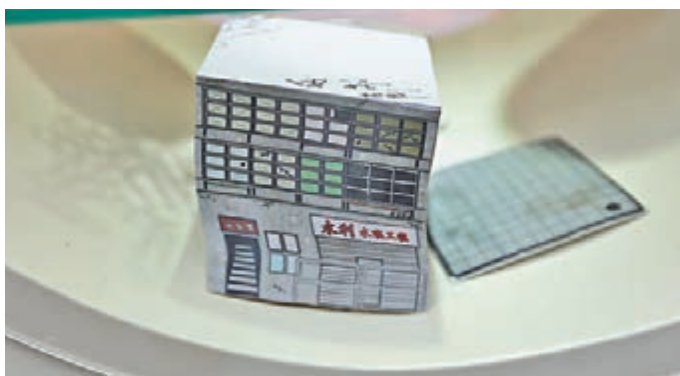
■唐樓——被拆卸的備忘錄。 本報貴州傳真