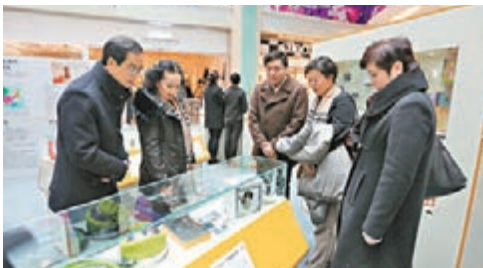
■創意產品吸引了不少市民駐足。

香港文匯報訊（記者 路曉寧 貴陽報道）可收納耳機線的香蕉繞線器、被拆卸的唐樓、可擦寫的行李標籤……為期8天的香港禮品設計展昨日在貴陽拉開序幕，各種五花八門的創意產品，吸引了不少市民駐足觀看。其中，「被拆卸的唐樓」是一疊印有香港舊式唐樓的便箋紙，隨着使用者把備忘錄一頁頁撕下，整座大樓便會如現實逐漸被拆卸，最後會消失於桌上。