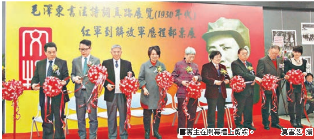
賓主在開幕禮上剪綵。

是次展覽由中華文物保護協會、香港特別行政區黃埔軍校同學會、香港文化國際傳播有限公司聯合主辦。展期至2月6日。