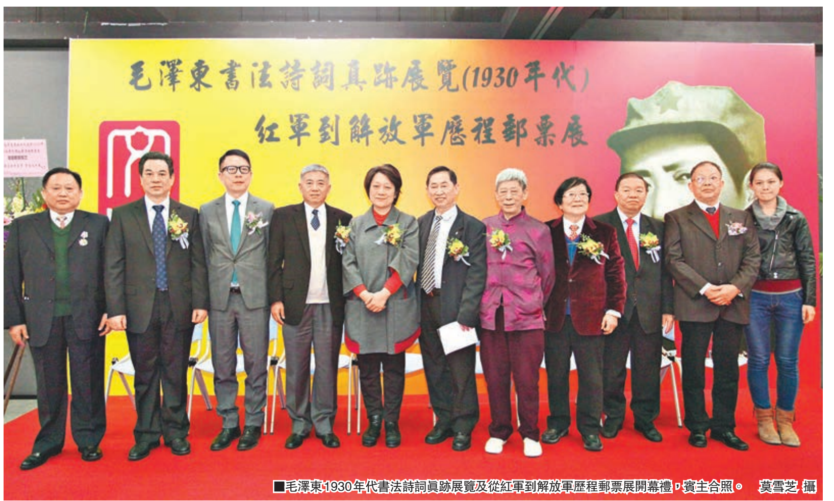
毛澤東1930年代書法詩詞真跡展覽及從紅軍到解放軍歷程郵票展開幕禮,賓主合照。