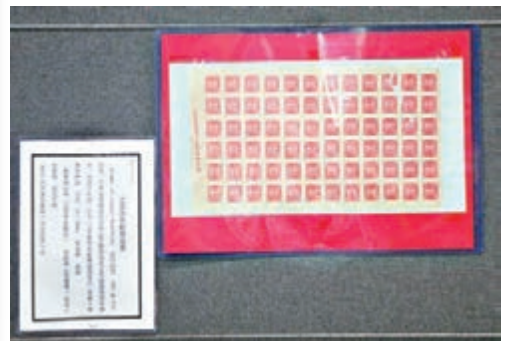
江西赤色郵政郵票72枚,極具收藏價值。