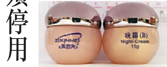
其中一款需停售的「紫欣美晚霜」。

女病人提交的3款產品樣本經醫管局分析化驗後,顯示水銀含量分別為可接受水平的3,319倍、1,385倍和10,585倍。衛生防護中心發言人表示,因3款產品的水銀含量遠超於可接受水平,使用這些產品或會導致嚴重副作用,市民應立即停用這些產品。中心的調查仍然繼續,有關個案已轉交海關,並作出即時跟進。