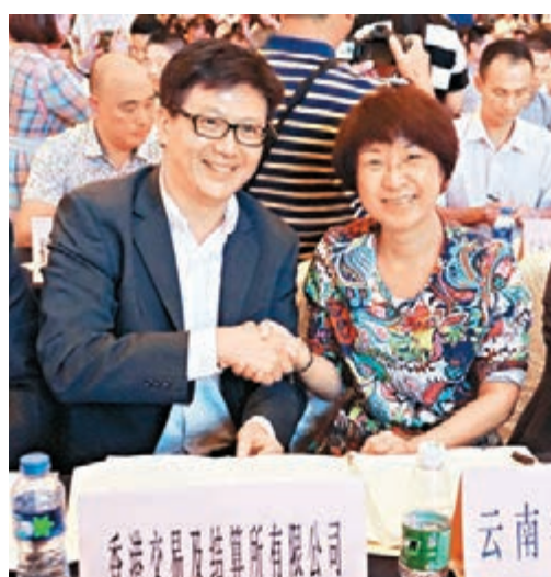
2014年泛珠大會期間，港交所與雲南省金融辦簽訂合作協議。

香港文匯報訊(記者 芮田甜 昆明報導)記者日前從雲南省招商合作局新聞通報會獲悉，2014年香港實際注入雲南外資19.8億美元，同比增12%，佔雲南外資總量73%，投資主要集中在服務業、製造業、高原特色農業、金融產業及房地產等領域。