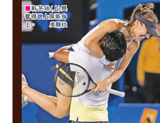
軒芝絲(上)與賽得跳上佩斯身上。