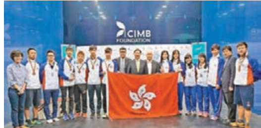
港壁在亞青團體賽成績不俗。

香港壁球隊昨日在吉隆坡舉行的亞洲青少年團體錦標賽取得2枚獎牌，女隊在決賽以總場數1:2惜負東道主馬來西亞，獲得銀牌，而男隊則在4強以總場數0:2負巴基斯坦，奪得銅牌。