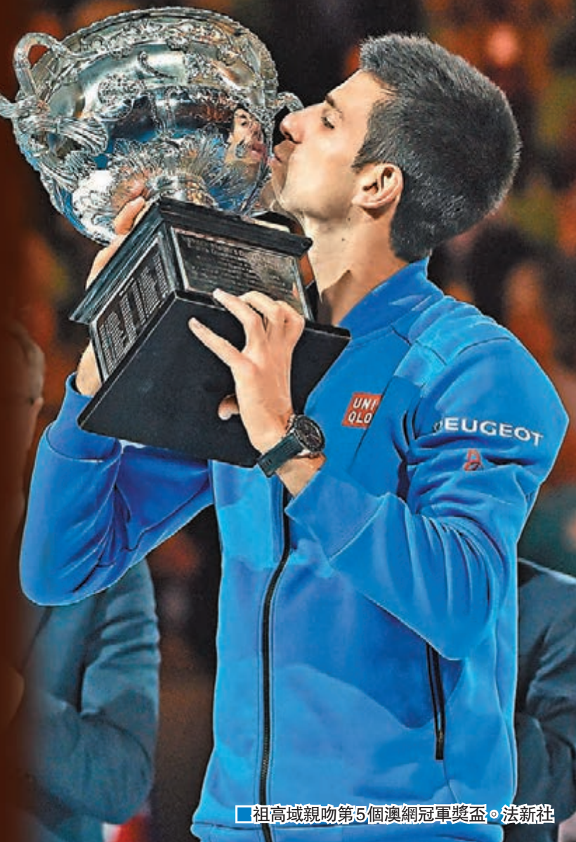
祖高域親吻第5個澳網冠軍獎盃。