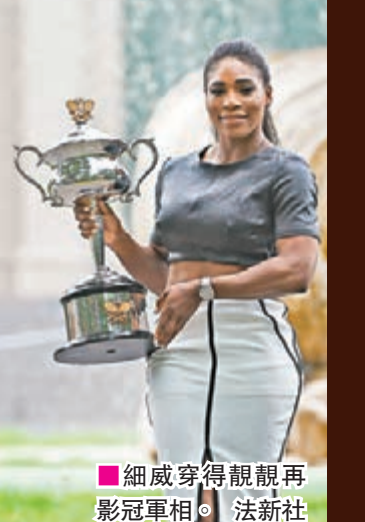
細威穿得靚靚再影冠軍相。法新社