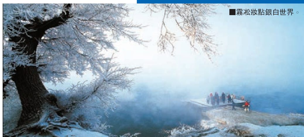
■霧凇妝點銀白世界。

以「中韓旅遊年」活動為重要契機，承辦中國旅遊年開幕式的部分文藝演出，組織開展「旅遊吉林—大篷車宣傳推廣周」活動，協助長白山管委會舉辦中韓青年「相約到白頭」百人集體婚禮、「韓國人看吉林」攝影作品評選和「印象吉林」采風踏線等活動。鼓勵旅遊企業在中韓兩國互設旅行社；爭取開通長白山煙臺—首爾航線。