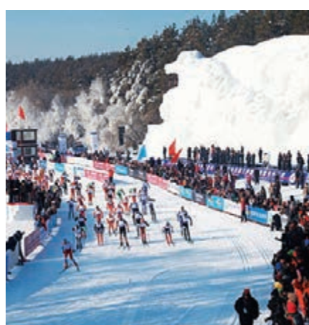
■長春冰雪旅遊節暨淨月潭瓦薩國際滑雪節。

加大旅遊市場開發力度。2015年，吉林將重點加大對省內、周邊市場及北京、「長三角」、「珠三角」的宣傳力度，利用其集散功能與輻射效應，擴大吉林省旅遊宣傳範圍。同時培育和發展重慶、湖北、陝西、河南等新興客源市場；組織與廣東、台灣、福建等地開展「你來我往」、「交換冬天」等大型旅遊推廣活動；鞏固擴大第6屆海峽兩岸旅遊交流圓桌會議成果，加強與台灣旅遊業界深度合作；全力打造吉林旅遊業升級版。擴大產業規模，提升發展質量，探索利用各種社會資源，擴大旅行社規模和經營範圍的新網絡。籌建1-2家大型旅行社企業集團，推動旅遊企業