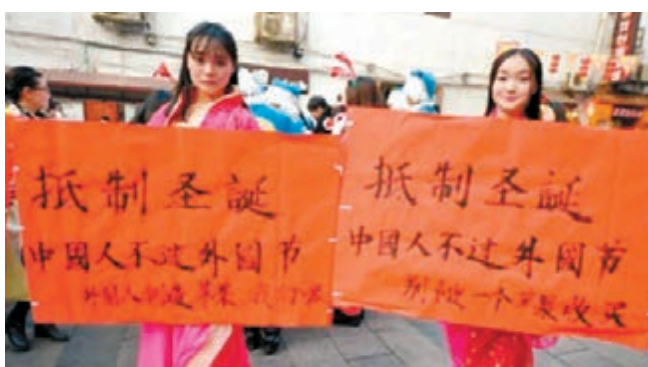
去年聖誕節，中國西北大學現代學院封校，禁止學生慶祝平安夜。圖為湖南一所大學抵制聖誕。