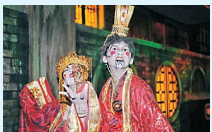
中式的殭屍在海洋公園的萬聖節派對中出現，是「中西共融」還是「消費主義」，值得讀者深思。 資料圖片

情人節的特色是情侶互相贈送禮物。時至今日，人們喜歡以情人卡向愛人表達情意，而各大商場都布置得美輪美奐，各食肆推出情人節套餐，目的在讓情侶盡情消費，賺取金錢。