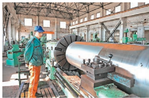
圖為山東日照一家企業員工用車床加工產品部件。