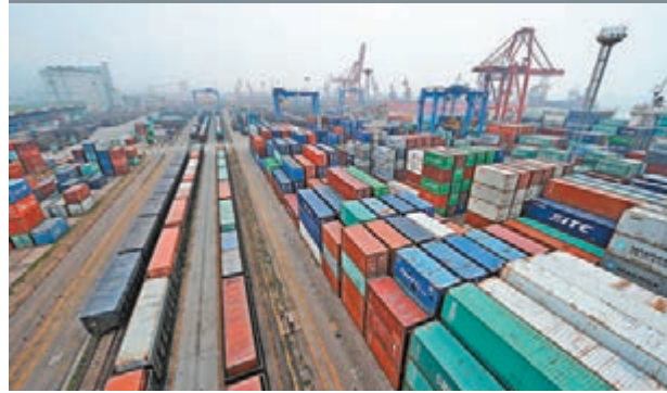
圖為江蘇連雲港港區內的新亞歐大陸橋鐵路運輸專線站場。

香港文匯報訊 推進「一帶一路」建設工作會議近日在北京召開。中共中央政治局常委、國務院副總理張高麗主持會議並講話。新華社1日報導,會議認真學習貫徹習近平總書記關於「一帶一路」建設的重要講話和指示精神,學習李克強總理等中央領導的指示批示要求,安排部署2015年及今後一段時期推進「一帶一路」建設的重大事項和重點工作。