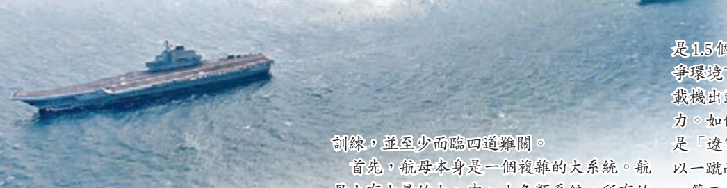
■遼寧艦編隊訓練結束後回港。資料圖片

從軍方證實中國正在改建航母，到「遼寧艦」交付海軍，再完成艦載機攔阻艦及編隊出海軍，中國近年正以驕人的成績，向全世界宣示中國「航母」時代的來臨。然而，中國航母編隊要真正成形並生成實戰能力，還有相當長的路要走，尚需時間進行磨合與