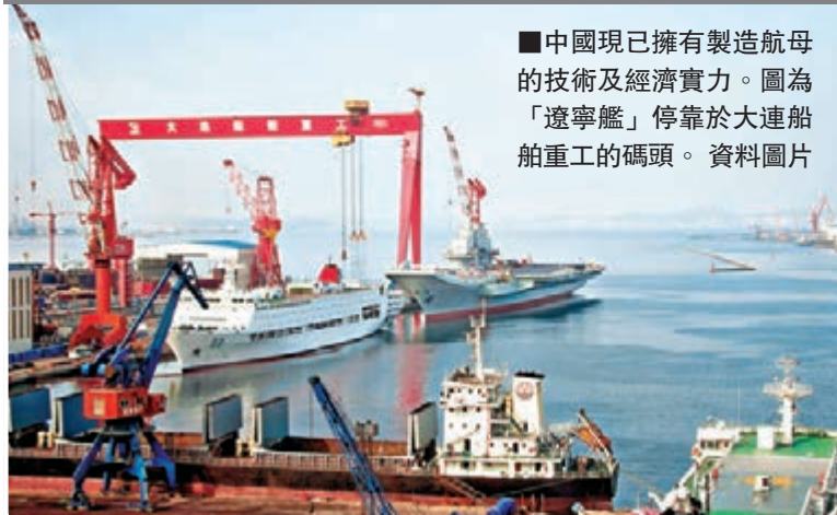
■中國現已擁有製造航母的技術及經濟實力。圖為「遼寧艦」停靠在連大連船舶重工的碼頭。資料圖片

中國是否需要建造自己的航母增強海上防衛能力問題，近年備受各方關注。早前已有多位解放軍高級將領表示，中國需要建造屬於自己的航空母艦，並已具備建造航母的經濟和技術實力。