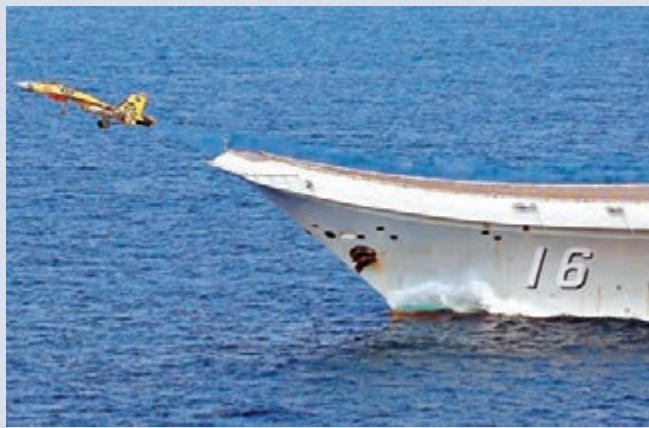
■第二艘航母或將沿用滑躍甲板。