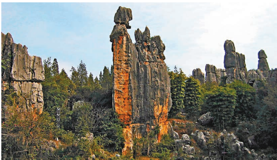
中國喀斯特世界自然遺產雲南石林。圖為石林著名景點「阿詩瑪」。