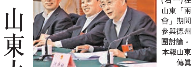
山東省長郭樹清（右一）在「兩會」期間參與德州團討論。

香港文匯報訊（記者 殷江宏 山東報道）相較於徽商、晉商、浙商的群體崛起，山東企業在外則多以「單打獨鬥」的個體形象出現。為了改變這一現狀，山東近期在全省企業中開展「厚道魯商」倡議行動，擬把誠信建設提升到制度保障層面，提升山東企業整體形象。山東省長郭樹清日前在《政府工作報告》中明確提出，將大力推進標準建設，積極探索「山東標準」，努力提升產品質量、工程質量、服務質量，創造更多山東品牌。