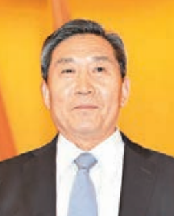
河南省政協副主席史濟春。

史濟春於1955年1月生於河南長垣，漢族，天津大學研究生院管理工程專業畢業，研究生學歷，碩士學位，高級工程師，享受國務院特殊津貼。2003年1月，史濟春任河南省副省長、省政府黨組成員；11月任河南省副省長、省政府黨組成員兼省國有資產監督管理委員會主任；2008年1月23日，在河南省第十一屆人大一次會議上連任河南省副省長；2011年10月30日，在河南省第九次黨代表大會上當選為河南省委常委，並於2012年1月，任河南省委常委、統戰部長。