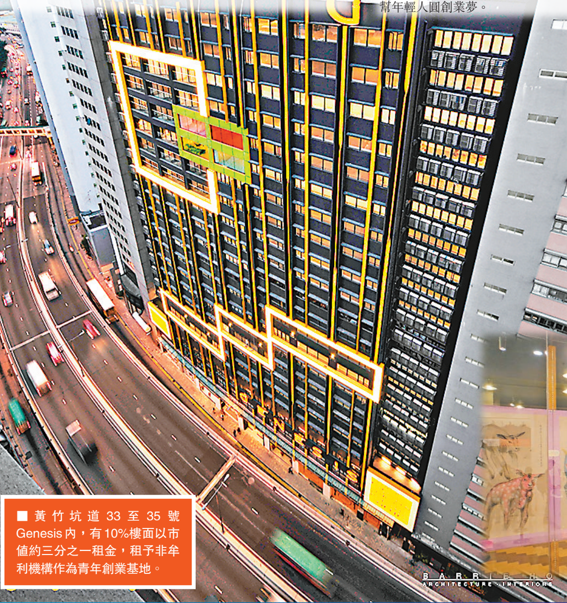
黃竹坑道33至35號Genesis內，有10%樓面以市值約三分之一租金，租予非牟利機構作為青年創業基地。

新加坡和香港，皆是欠缺天然資源，地小人多的地方，但通過科技，即可「化小為大」，實現無限可能。