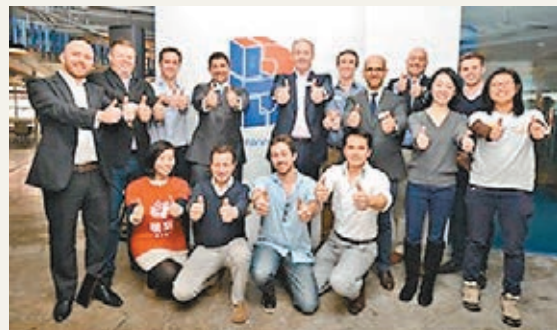
太古地產管理層與11家獲選創業公司合照。

同樣有心支持科技創投公司的太古地產（1972）早前已推出免租半年blueprint創業加速計劃，其最新大計是可用低至每人每月付2,000元，便可租用太古坊康和大廈16樓的辦公室共用空間以推廣創業文化。太古地產行政總裁白德利表示，blueprint創業加速計劃涉資2,000萬港元，若計劃成功不排除擴展至中國內地。