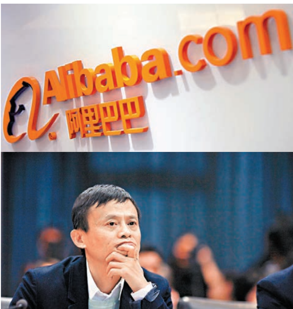
圖為阿里巴巴創辦人馬雲。

另外，馬雲亦曾說「絕不做遊戲」但《華爾街日報》昨日就引述消息人士指，阿里已投資Android遊戲主機開發商Ouya，投資金額為1,000萬美元。這筆錢將用來幫助Ouya完善產品、豐富遊戲庫。阿里巴巴正與Ouya討論，將後者的遊戲移植到阿里的機頂盒內。Ouya是一家以Android平台向用戶提供遊戲和遊戲主機的開放平台。