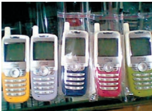
輻射低、待機長但功能少的小靈通手機。

香港文匯報訊(記者 達明 天津報道) 天津聯通公司對外發佈，小靈通網絡將於2月1日0:00起停止服務和收費。由於天津是小靈通業務最後一批退市的城市，意味着從下月起，這項曾擁有一億客戶的電訊業務將在中國大陸銷聲匿跡。據介紹，從2011年起，天津聯通推出了「靈通升級」服務，2月1日小靈通停止服務後，未能及時升級的小靈通用戶仍可辦理升級轉網。