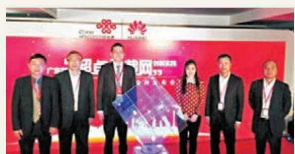
華為稱，業界最小的原子路由器全球首商部署，可實現無縫接入4G/3G移動承載網絡。 資料圖片

香港文匯報訊(記者 古寧 廣州報道) 中國聯通(0762)廣東省分公司和華為30日宣佈，雙方通過聯合創新，基於華為智能感知方案完成了原子路由器全球首次商用部署。業界人士表示，這將有助廣東聯通超卓承載網建設，為用戶帶來最佳的移動業務體驗。廣東聯通表示，此次聯合華為基於原子路由器的創新實踐，成功將原子路由器方案引入廣東聯通移動承載網絡，契合其超卓承載網的發展戰略。