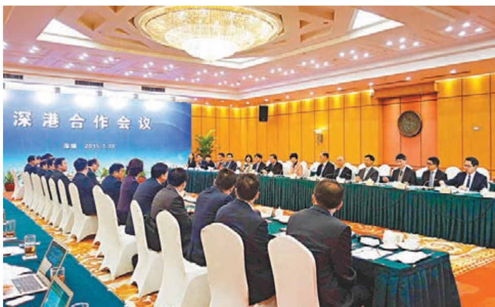
■一年一度的深港合作會議在深圳舉行，其中青年合作是今屆會議其中一個重點。

香港文匯報訊（記者 李望賢 深圳報導）香港特區政務司司長林鄭月娥昨日赴深與深圳市長許勤共同主持一年一度的深港合作會議，雙方並敲定了來年合作四大重點，包括前海、金融、青年交流以及醫療服務。其中，青年合作是今屆深港合作會議的一大亮點。林鄭月娥表示，雙方來年會重點推動青年交流、實習和創業等三方面的合作，包括落實大學生暑期實習計劃、志願服務交流、青年創業培訓班、深港青年風尚季、大學生聯合城市調研及前海參訪計劃6個項目。