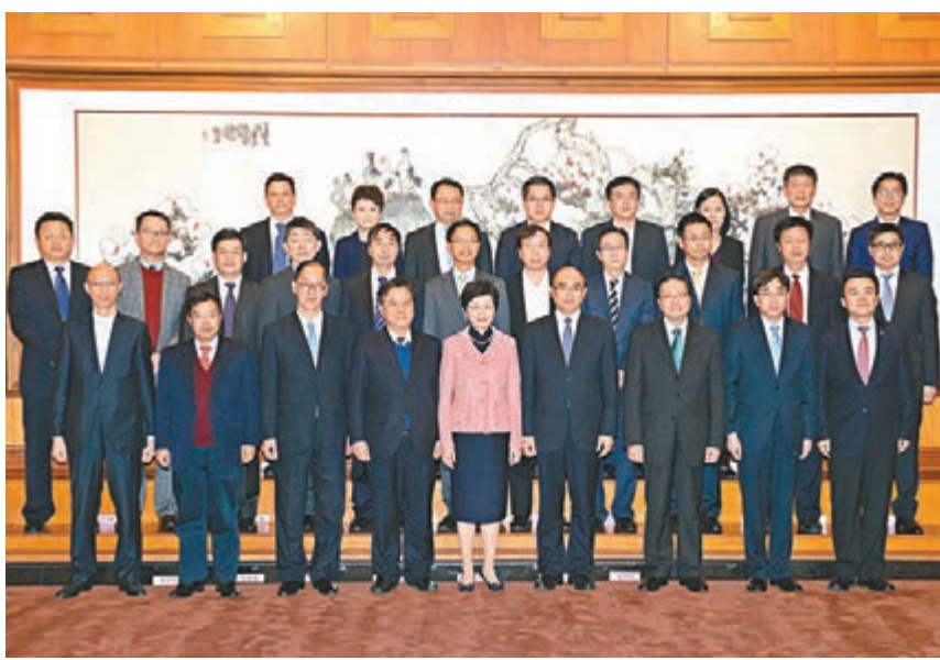
■林鄭月娥（前排中）與許勤（前排右四）共同主持深港合作會議，並與其他與會者合照。

林鄭月娥與許勤昨日在深圳共同主持深港合作會議。林鄭月娥指出，自2007年以香港特區發展局局長身份開始參與深港合作會議，今年已經跨進第八年。8年來見證了深港兩地合作範圍更深更廣，從早期的跨境基建、金融、貿易投資等範疇，發展到今天在專業服務、社會民生、環保等多方面合作，推進了經濟融合、民生改善，是兩地政府的共同願望。 她說：「過去一年，在香港和深圳雙方的共同努力下，各合作項目均取得良好的進展。2015年是國家全面深化改革的關鍵一年，為兩地合作帶來更多機遇。我期望深港雙方來年繼續加強各個領域的合作，實現互利共贏，造福兩地民眾。」