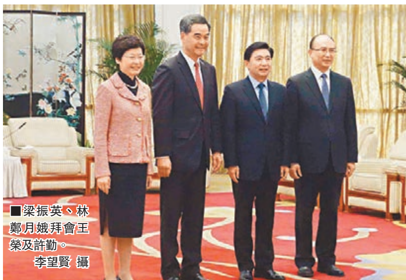
■梁振英、林鄭月娥拜會王榮及許勤。

陪同政務司司長出席會議的其他官員，包括特區運輸及房屋局局長張炳良、民政事務局長曾德成、食物及衛生局局長高永文、環境局局長黃錦星、政制及內地事務局常任秘書長張瓊瑤、商務及經濟發展局副局長梁敬國和發展局副局長馬紹祥。