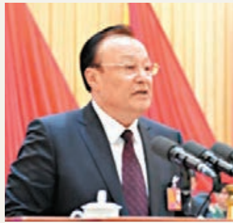
新疆代主席雪克來提·扎克爾。

香港文匯報訊(記者王辛鵬烏魯木齊報導)新疆代主席雪克來提·扎克爾日前在自治區第十二屆人大三次會議上作政府工作報告時指出,2014年新疆在暴恐事件頻發、經濟下行壓力增大的嚴峻形勢下,國民經濟發展主要指標均保持或鞏固了上行比全國快、下行比全國慢的局面,預計全年完成地區生產總值9,200億元(人民幣,下同),增長10%;全社会固定資產投資首次突破萬億元大關,達到10,185億元,增長25%。