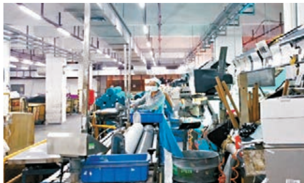
互太紡織生產基地廠房。