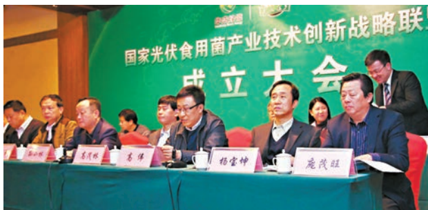
國家光伏食用菌產業技術創新戰略聯盟成立大會。本報青島傳真

同時,去年浙江省城鎮常住居民人均可支配收入為40,393元,比上年同期增長了8.9%;農村常住居民人均可支配收入為19,373元,同比增長了10.7%。