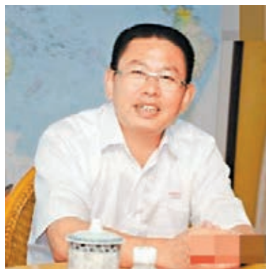
張華榮稱,隨着全球經濟放緩,鞋業面臨的風險和受到的影響遠超預期。

在本次論壇上,博鰲論壇原秘書長、原外經貿部副部長龍永圖建議東莞鞋業重視產業鏈整合,加強發展生產性服務業,促使企業逐步向產業鏈的高端發展,形成包括總部基地、研發中心等業態。