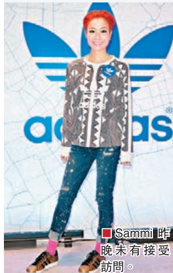
Sammi昨晚未有接受訪問。