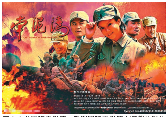
在中美國際電影節、歐洲國際電影節上獲獎的影片《南泥灣》。