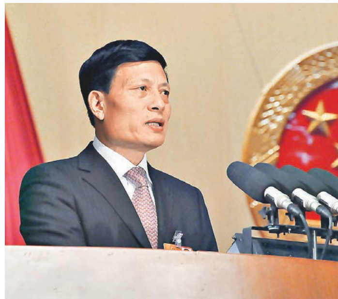
河南省省長謝伏瞻作政府工作報告。