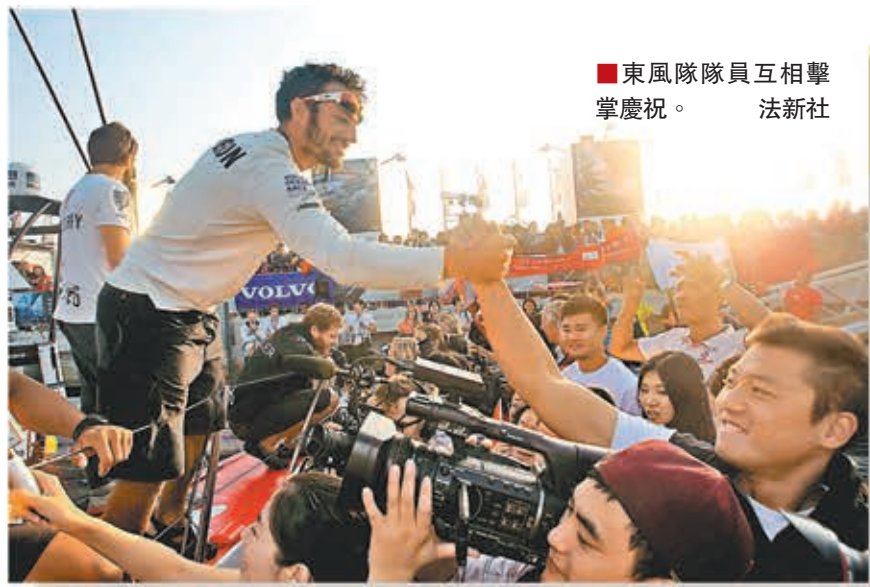
東風隊隊員互相擊掌慶祝。