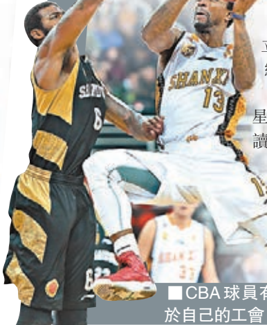
CBA球員有望成立屬於自己的工會。

據內地媒體《法制晚報》報道,球員工會的建立提上籃協日程,CBA球員也將有了自己的「組織」。日前,中國籃協就前一階段的裁判爭議、全明星賽爭議以及管辦分離等方向進行了詳細解讀。除了已經成立的裁判管理委員會,CBA聯賽辦提出在聯賽委員會之下成立財務管理委員會、爭議處置委員會和球員工會。