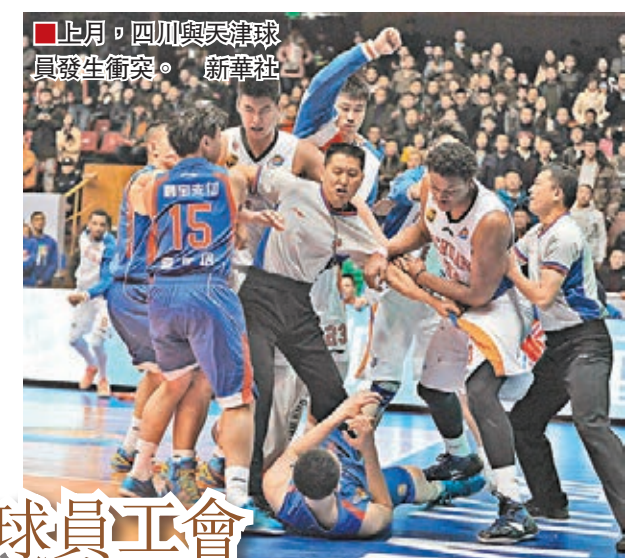
上月,四川與天津球員發生衝突。