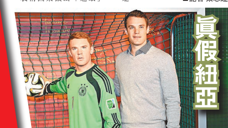
去夏世界盃多次出禁區瓦解威脅助德國隊贏得冠軍的門神紐亞，日前在柏林杜沙夫人蠟像館為以自己踢世盃決賽的英姿作模、製作費用了約20萬歐元（約176萬港元）的蠟像揭幕。他說：「這是100%的紐亞，蠟像將決賽一刻的我定格，成為永恆。」

列奧斯鬼馬慶祝變財路 早幾年爭標分子多蒙特今季慶慶祝動作，成為熱話。近日他親身為自己以此圖案作主題的猴子T恤和鴨嘴帽做代言。T恤每件約176港元，收入會作慈善用途。 ■記者 梁志達