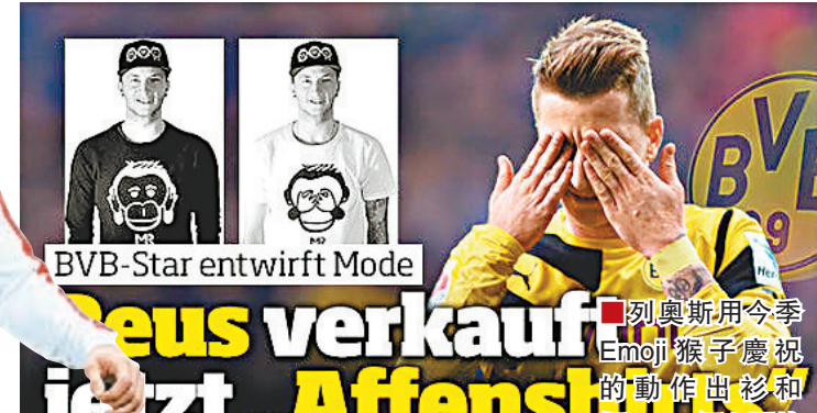
BVB-Star entwirft Mode

列奧斯鬼馬慶祝變財路 早幾年爭標分子多蒙特今季慶慶祝動作，成為熱話。近日他親身為自己以此圖案作主題的猴子T恤和鴨嘴帽做代言。T恤每件約176港元，收入會作慈善用途。 ■記者 梁志達