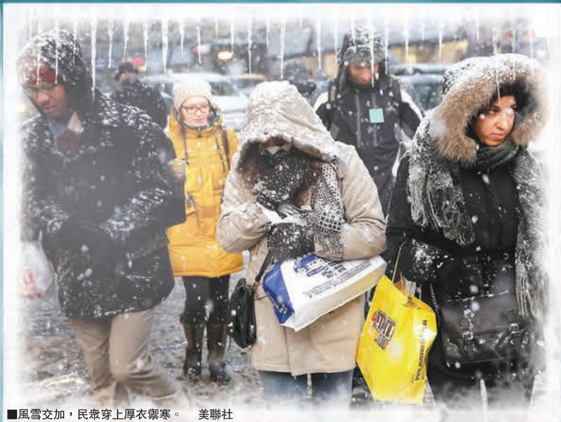
風雪交加，民衆穿上厚衣禦寒。